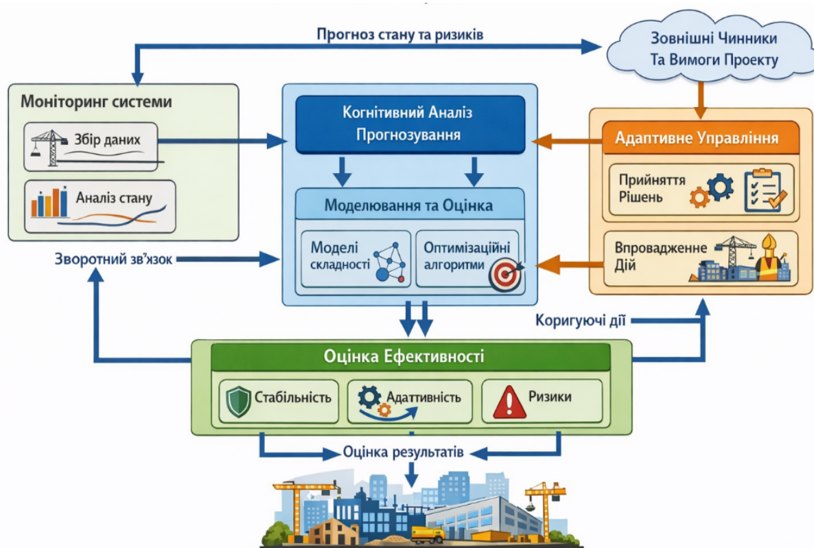
Рис. 4. Концептуальна схема реалізації когнітивно-інтеграційного управління організаційно-технологічною складністю будівельної системи (розроблено автором на основі [11])