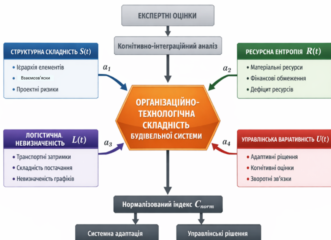
Рис. 1. Когнітивно-інтеграційна структура формування організаційно-технологічної складності будівельної системи (розроблено автором на основі [4])

На рисунку 1 представлено когнітивно-інтеграційну структуру формування організаційно-технологічної складності будівельної системи, яка відображає взаємодію основних компонентів складності, механізмів когнітивного аналізу та результатів управлінського впливу [4].