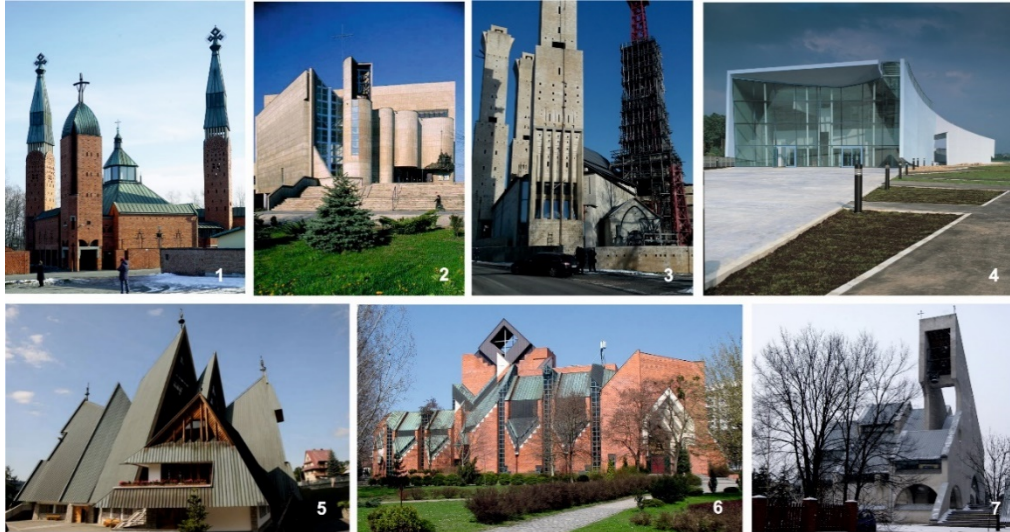
Рис. 1. Стильове різноманіття культових споруд польського постмодернізму: 1–Костел Ісуса Христа Спасителя в Чеховіце-Дзедзіце, арх. С. Немчик, 1995–2000. Фото Г. Осиченко; 2–Костел Святої Ядвіги у Кракові, арх. Р. Леглер, 1979–1989 [31]; 3– Церква Святого Франциска Ассізького та Святої Клари у Тихи, арх. С. Немчик, у процесі будівництва. Фото Г. Осиченко; 4 –цвинтарна каплиця «Брама до Міста Мертвих» у Кракові, арх. Р. Леглер, 1998 [31]; 5 – Храм Матері Божої Чудотворного Медальйона в Закопане, арх. Т. Гавловський, Т. Лісовська-Гавловська, 1980–1988 [32]; 6 – Церква Пресвятої Діви Марії, Цариці Миру у Вроцлаві, арх. В.Гриневич, В. Яжомбко та Я. Матковський, 1982–1994 [33]; 7 – Костел Непорочного серця Пресвятої діви Марії у Кракові, арх. Є. Петеленд, 1983–1995 [34].

архітектура. Специфіка польської версії постмодернізму особливо простежується на прикладі двох видатних сакральних об'єктів Польщі, які ці напрями яскраво втілюють.