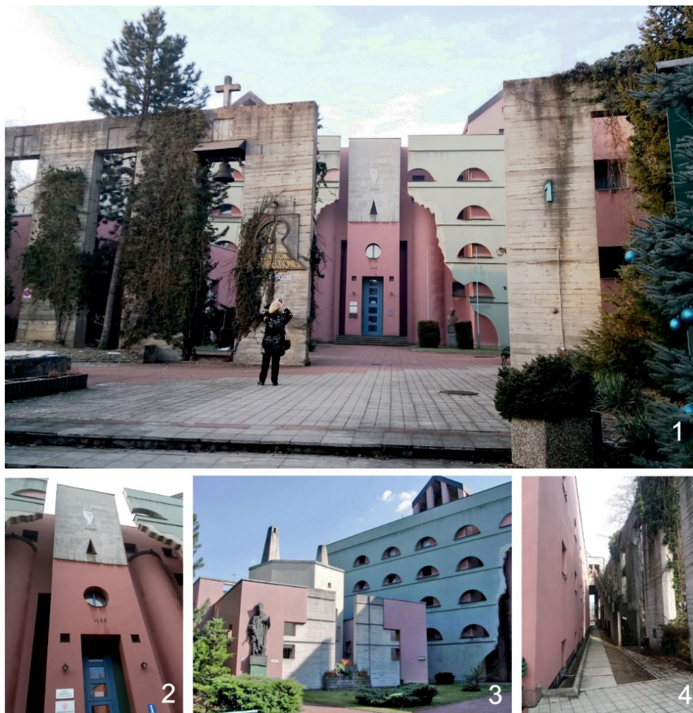
Рис. 4. Вища Духовна Семінарія Отців Воскресників у Кракові: 1 – Брама Посвяти - розрив в огорожі семінарії; 2- головний вхід, акцентований «розривом» у накладній ажурній стіні та круглим вікном («око Господа»); 3 – «фальшиві брами» бокового корпусу та Двір Бажань ; 4 – центральна огорожа семінарії зі сходами на дах.