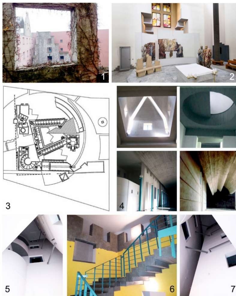
Рис. 6. Вища Духовна Семінарія Отців Воскресників у Кракові: 1- вид з коридору хостела на внутрішній двір Молоді. На першому плані накладна бетонна стіна, обвита плющем; 2 – вітвар головного храму. Світлини Г. Осиченко; 3 – план другого поверху [40]; 4 – поетика бетону в інтер'єрах: освітлення залів (вверху), «фальшиві» склепіння (внизу) [20, с.68]; 5, 7 – окремі сходи у хостел та їх кріплення до зовнішніх стін; 6 – внутрішній простір сходів у хостел. Світлини Г. Осиченко

потенціал оновлення. Особливо виразно це проявляється у Дворіку Молоді, де «накладні» бетонні стіни оживляють простір грою світла й тіні (рис.6).