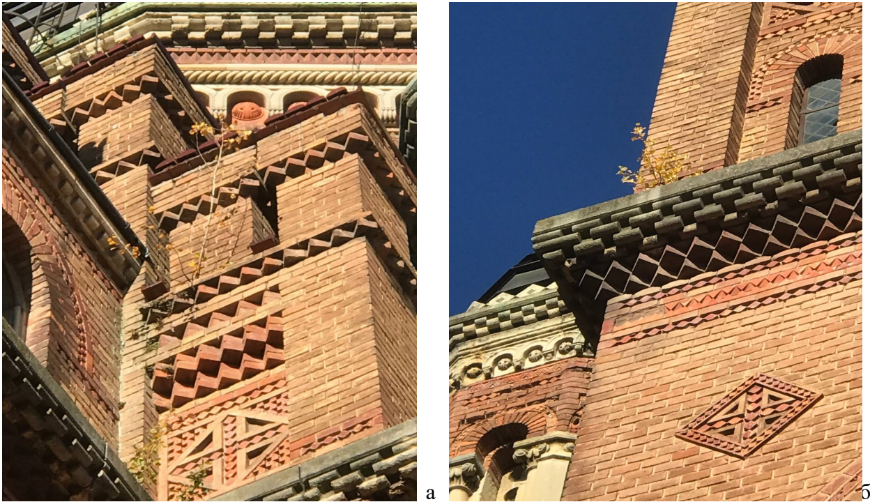
Рис. 2. Ділянки фасаду Семінарської церкви з самосівними рослинами, віком 1-3 роки до видалення рослинності: а) деревця липи; б) деревце дубу