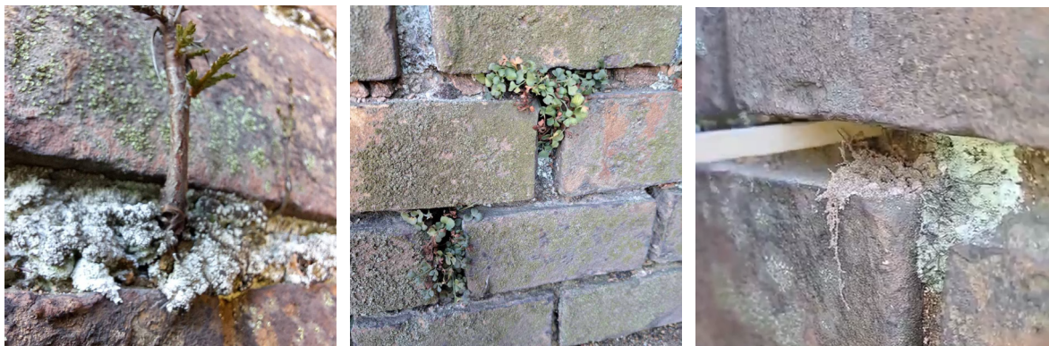
Рис. 4. Біодеструкція швів цегляної кладки рослинами і процес їх видалення (фото 2025).