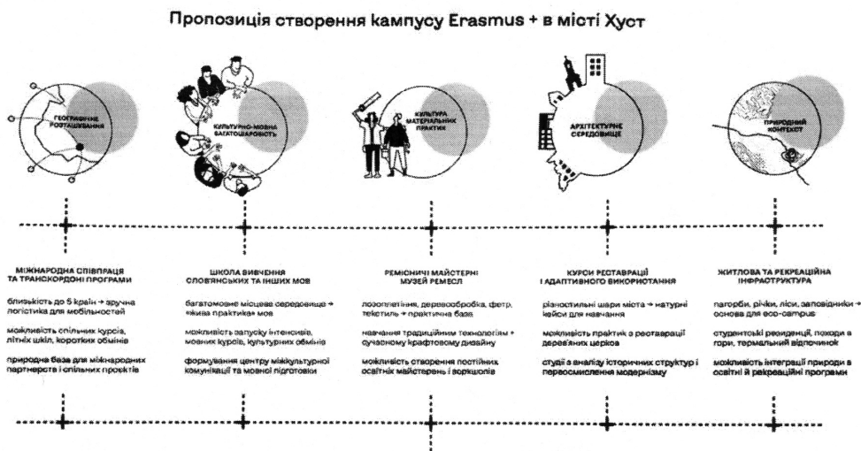
Рис. 1. Концептуальна пропозиція створення міста кампусу Erasmus+ в м. Хуст (ст. Ружанська Г.)

Коротко наведемо приклади результатів які в значній мірі здивували і самих студентів і керівників, а головне чому цього не помічали при розробці стандартних генеральних планів. Тому такий підхід коли працює молодь яка хотіла б жити в цих містах, незаангажована суспільними та політичними перипетіями, з можливістю реалізації своїх інтересів в роботі, відпочинку та побуті, має стати основою нових комплексних планів. І неважливо що можливо ідея не зовсім відповідає державним будівельним нормам, правилам побудови, це можна, це ні. Ми дуже довго проєктували для тих хто буде жити 10 - 20 років інколи не розуміючи, які вони будуть і що їх буде цікавити, і при цьому не бачили самого живого організму – міста.