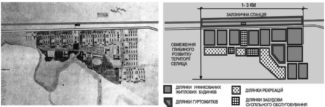
Рис. 4 Схема генплану РСЗ при станції Кондрашівська залізничної мережі «Москва-Донбас» [3] та схема її функціонально-планувальної організації (робота автора)

Композиція РСЗ формувалась з врахуванням її сприйняття пасажирями потягів, що проходили повз. Основний ритмічний фон утворювали шляхові будівлі, інші технічні споруди станції. Головним завданням для архітекторів було досягнення композиційної цілісності містобудівного комплексу. Це, за задумом авторів, досягалось за рахунок стилістичної єдності близьких за масштабом, але за різних за функціональним призначенням об'єктів, а також різномасштабних споруд однієї функціональної групи (рис.5).