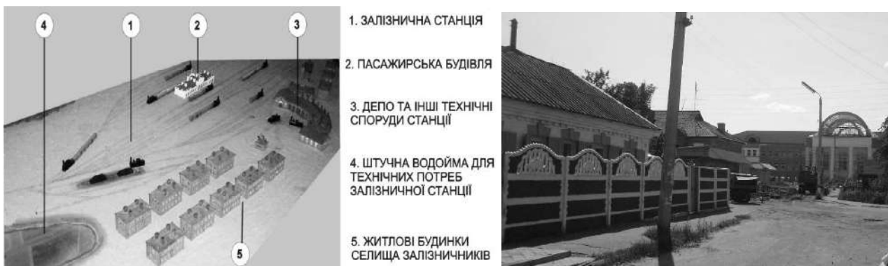
Рис.6. РСЗ при станції Куп'янськ-Вузловий. Макет. (Музей залізничного транспорту в м. Куп'янськ) . Житлова забудова селища, що збереглася – на першому плані. (Фото автора, 2012 р.).

Початок сучасному місту Бахмач дали два селища залізничників, які утворилися у 1867 і 1873 роках для обслуговування Курсько-Київська та Лівово-Роменська залізниць поруч із старовинним сотенним торговельним містечком, яке існувало ще з 1654 р. З часом тут були побудовані: нові залізничні майстерні, депо, паровий млин, спиртовий завод, птахофабрика, електростанція, маслозавод та суконна фабрика. Сформоване на базі селищ місто поступово «поглинуло» селища залізничників. З'явилася як нова житлова забудова, так і чисельні об'єкти суспільного обслуговування [13]. Сьогодні на території міста з населенням більше 18 тис. мешканців знаходиться три залізничні станції «Бахмач-Київський», «Бахмач-Пасажирський», «Бахмач-Гомельський», які обслуговують чотири залізничні мережі. Залізниця продовжує суттєво впливати на розвиток міста Бахмач.