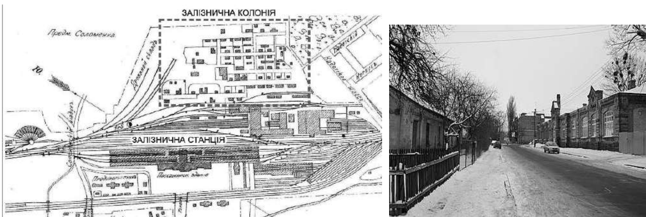
Рис. 3. Схема розміщення Залізничної колонії в м. Київ [7]. Фото забудови, що збереглася [6].

колонії». Особливих територіальних втрат вона зазнала у 80-х роках ХХ ст., в тому числі при побудові південного терміналу залізничного вокзального комплексу. Однак, частина РСЗ збереглася і до сьогодні та потребує містобудівного упорядкування, відповідного новим умовам.