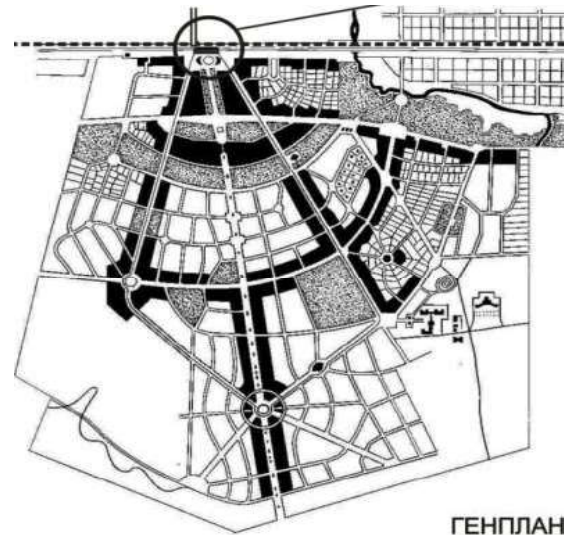
Рис. 2 Росія. Планування РСЗ на станції Прозоровська Московсько-Казанської Залізниці. 1913 р. [1].

Окремі соціально-економічні аспекти формування робітничих селищ залізничників висвітлювались і в низці публікацій з історії розвитку залізничного транспорту, економічної географії, краєзнавства [5-8, 14, 19-22].