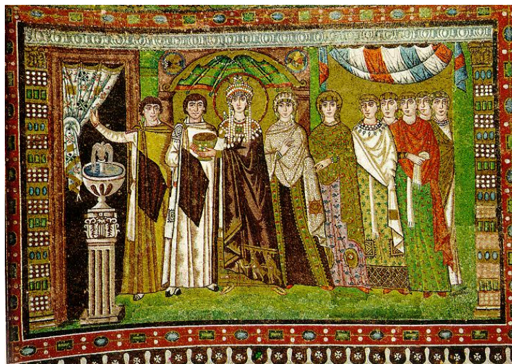
Рис.2. Імператриця Феодора зі свитою.