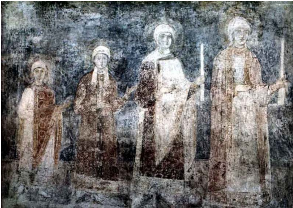
Рис.4. Доньки Ярослава Мудрого – майбутні європейські королеви.

мучеників і мучениць, зверху нанесено відповідні зображення і таким чином пошкоджено стан давніх фресок (Рис.4).