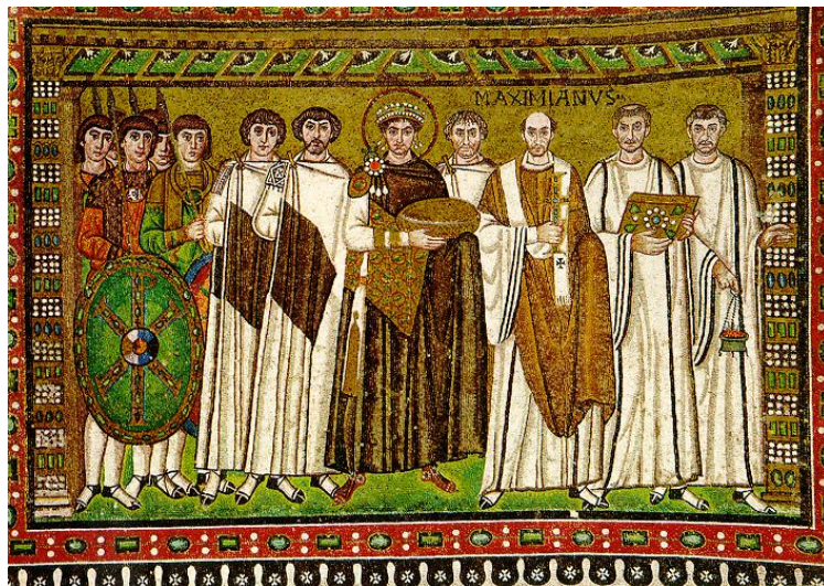
Рис.1. Імператор Юстиніан зі свитою.

Не можна сказати, що в візантійській храмовій архітектурі в оздобленні інтер'єрів були виключно канонічні сюжети: достатньо згадати мозаїчні композиції, які зображують імператора Юстиніана з придворними і священниками і імператрицю Феодору з придворними дамами в церкві Сан-Віталє в Равенні (Рис.1,2).