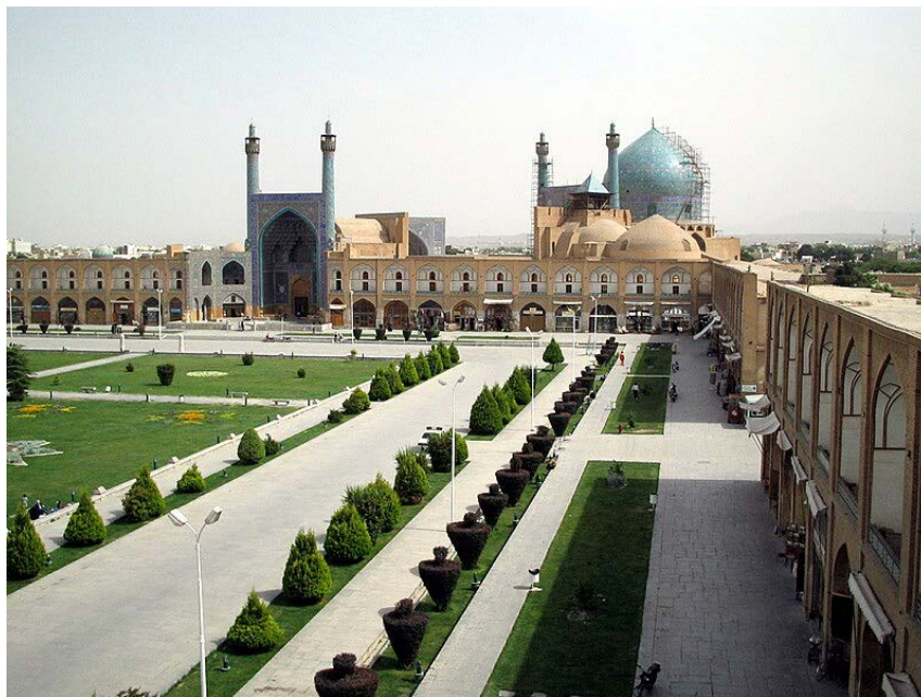
Рис.1. Мечеть Імама (Naghsh-e-jahan masjed-e-shah esfahan) в Ісфахані, Іран.

Першим таким терміном є айван (ейван), який являє собою склепінчасту залу, закриту стінами з трьох сторін і відкриту з четвертої, він відомий ще в парфянській і сасанідській архітектурі, де айвани виконували роль урочистих тронних залів, наприклад, в парфянському палаці Кухе-Ходжа (Іран), сасанідському палаці Ктесифон (Ірак). Ці місцеві традиції виявились настільки стійкими до змін, що сформували специфічний айванний тип мечеті Персії і підлеглих територій, зокрема, Середньої Азії (Рис.1).