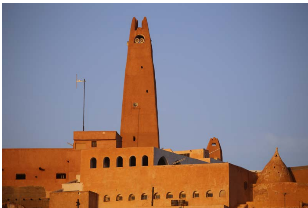
Фото 2. Велика мечеть Гардайї.

б) мечеті мозабітського типу (в долині р. Мзаб) підкреслено прості за формами, меншого розміру, з дуже товстими стінами і малими віконцями, з підземними ходами і сходами, часто без мінаретів взагалі (мінарети тільки в кількох головних мечетях і тільки проти стіни кібли або поряд з нею, з функціями сигнальних веж), наявність внутрішнього двору необов'язкова, в плануванні інтер'єрний простір колонного типу розділений на декілька автономних молитовних приміщень з власними стінами, будівельні матеріали дуже прості і тільки місцеві, без будь-якого декору (Фото 2);