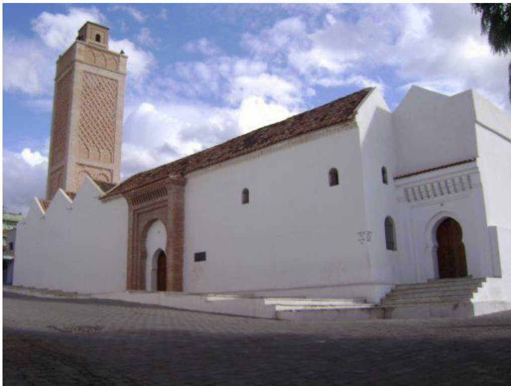
Фото 1. Мечеть в м. Недрома.

На основі натурних обстежень існуючих мечетей доведено, що основним елементом-виразником національної своєрідності в усі часи залишався мінарет магрибського (призматичний двоюрисний) або хариджитського типу (звужений догори пірамідальний з гострокутними елементами завершення), який став унікальним явищем в архітектурі: він виявився стійким до змін і протягом VII-XIX століть в різних варіаціях повторювався фактично один і той самий тип мінарету (відмінності полягали в висоті, пропорціях, кількості ярусів, завершенні, орнаментиці) (Фото 1).