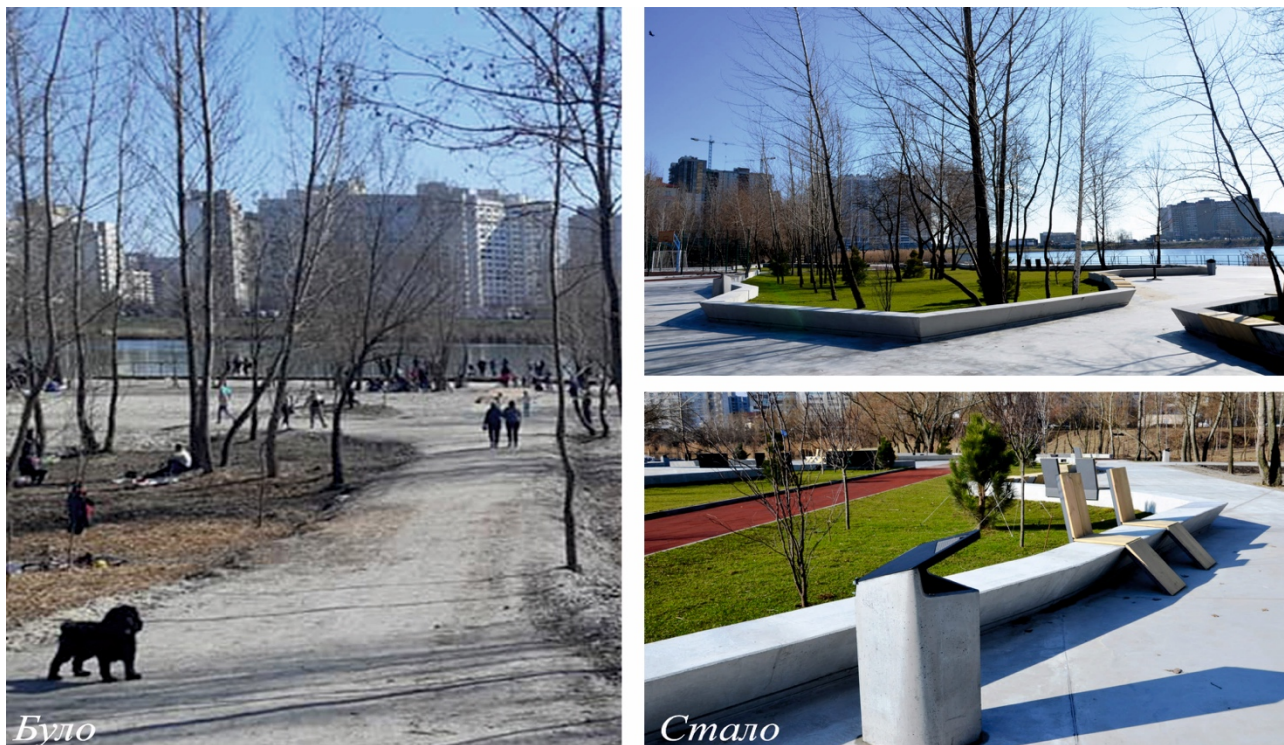
Рис.1. Парк на Лебединому озері Київ. До та після реконструкції.

розмістили зони відпочинку. Біля самої води встановили бесідки, берегова лінія укріплена габіонами, що надає їй стильного вигляду й робить привабливим для відпочинку біля самої води.