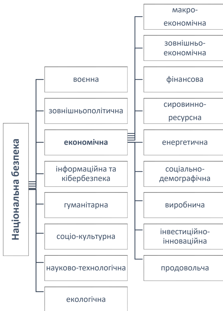
Рис. 1. Складові національної безпеки.

Економічна безпека розглядається як складова національної безпеки і виступає матеріальною основою національної безпеки (див. рис.1).