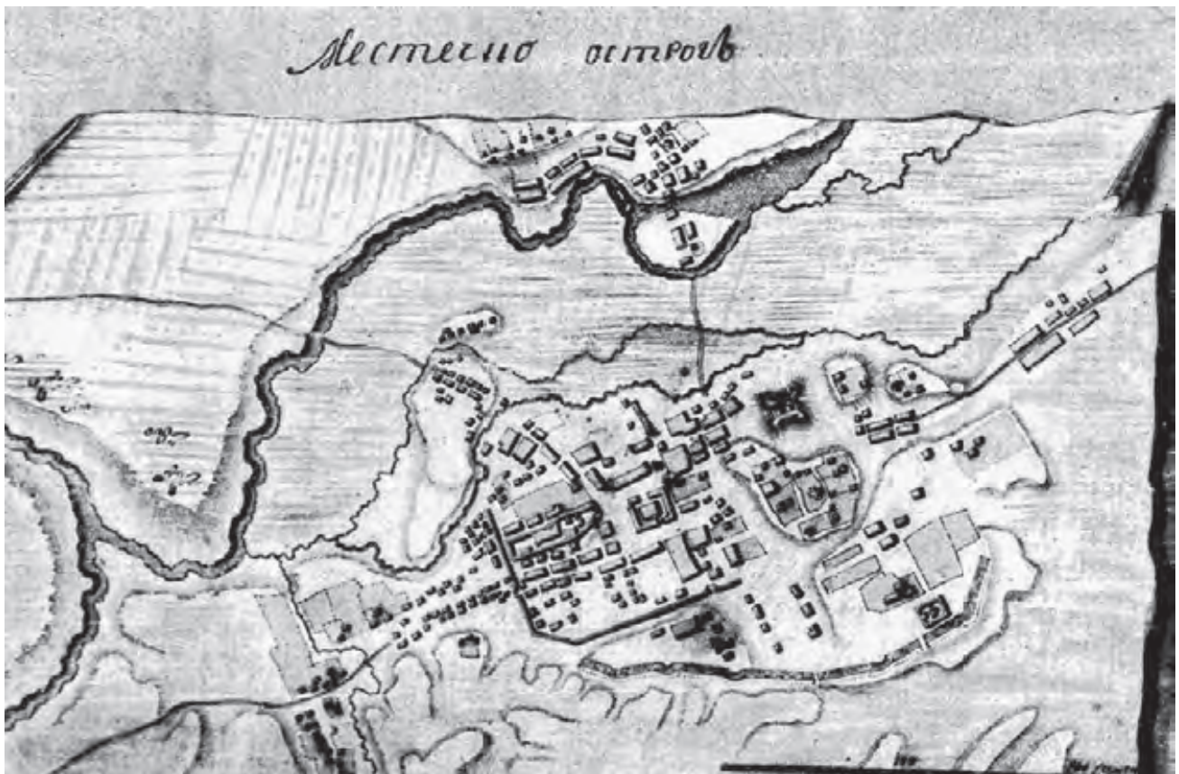
Рис. 2. Найдавніший відомий фіксаційний план Острога (1760-і роки ?).