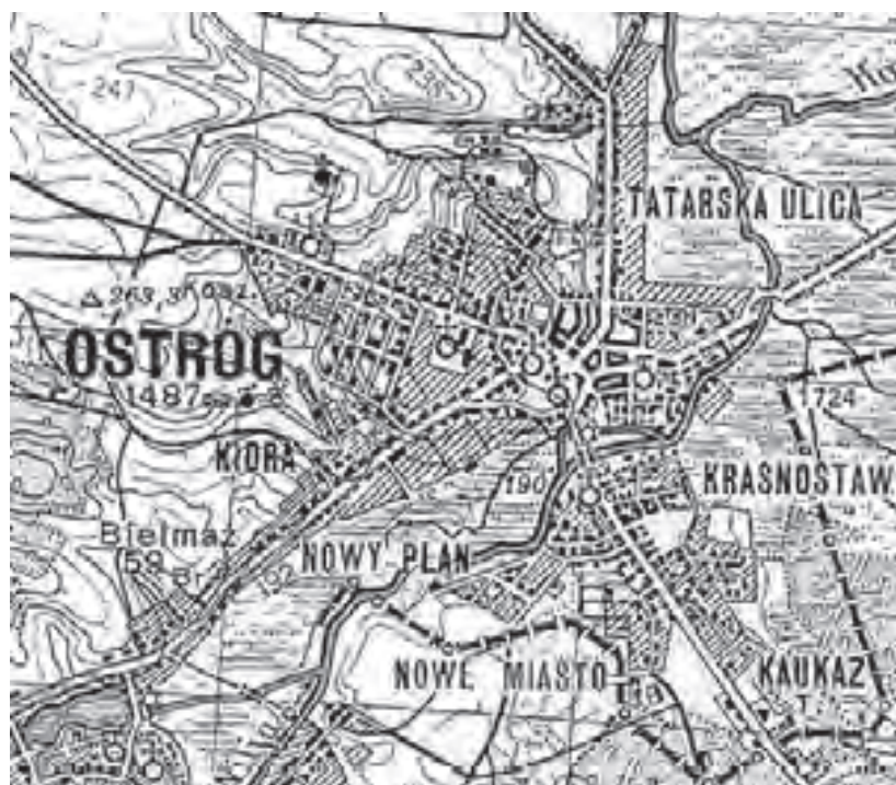
Рис. 7. Топографічний план Острога 1926 року. З приватної збірки.

Ці та інші новації кінця XIX – початку XX ст., доволі докладно зафіксував топографічний план 1926 року (рис. 7) [32], засвідчивши таким чином своєрідний підсумок довготривалого процесу просторово-розпланувальної еволюції Острога на протязі більш ніж дев'яти століть, починаючи від першої його згадки в літописних джерелах.