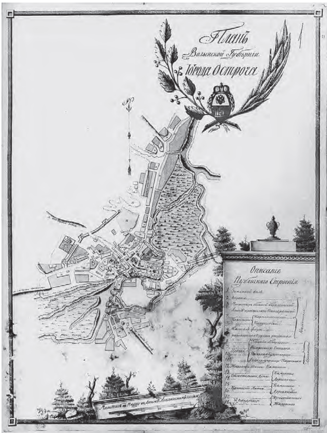
Рис. 4. «План Волинской губернии города Острога» (1798 р. ?).

Серед 12 міст Волинської губернії наявний тут і план Острога [18]. Явно репрезентативний і водночас реплікативний характер цього документу зумовив