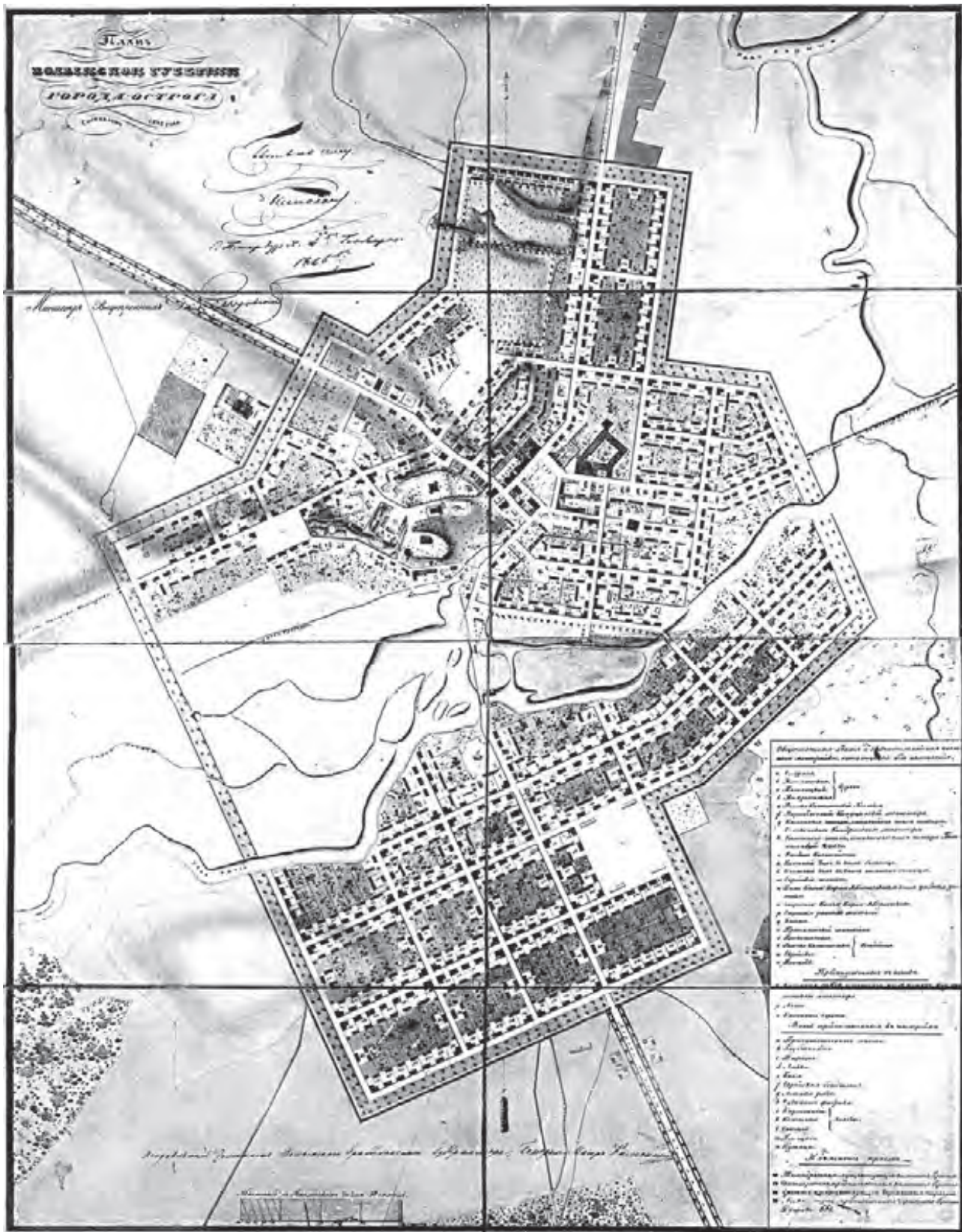
Рис. 6. «План Волынской губернии города Острога составлен 1845 года».

Було запроєктовано дві нові площі – одна на захід від П’ятницької церкви, друга – на Новому місті. Звертає на себе увагу також відведення під нову