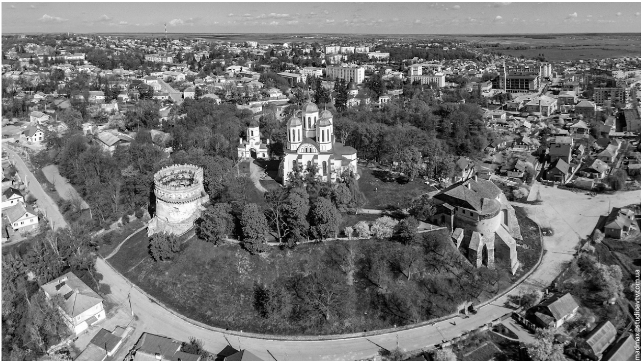
Рис. 1. Сучасний вигляд на Острозький замок та історичне середмістя Острога. 2021 р. URL: https://itvmg.com/news/v-ostrozi-oselyatsya-ostrogy-j-ostrozhyky-foto