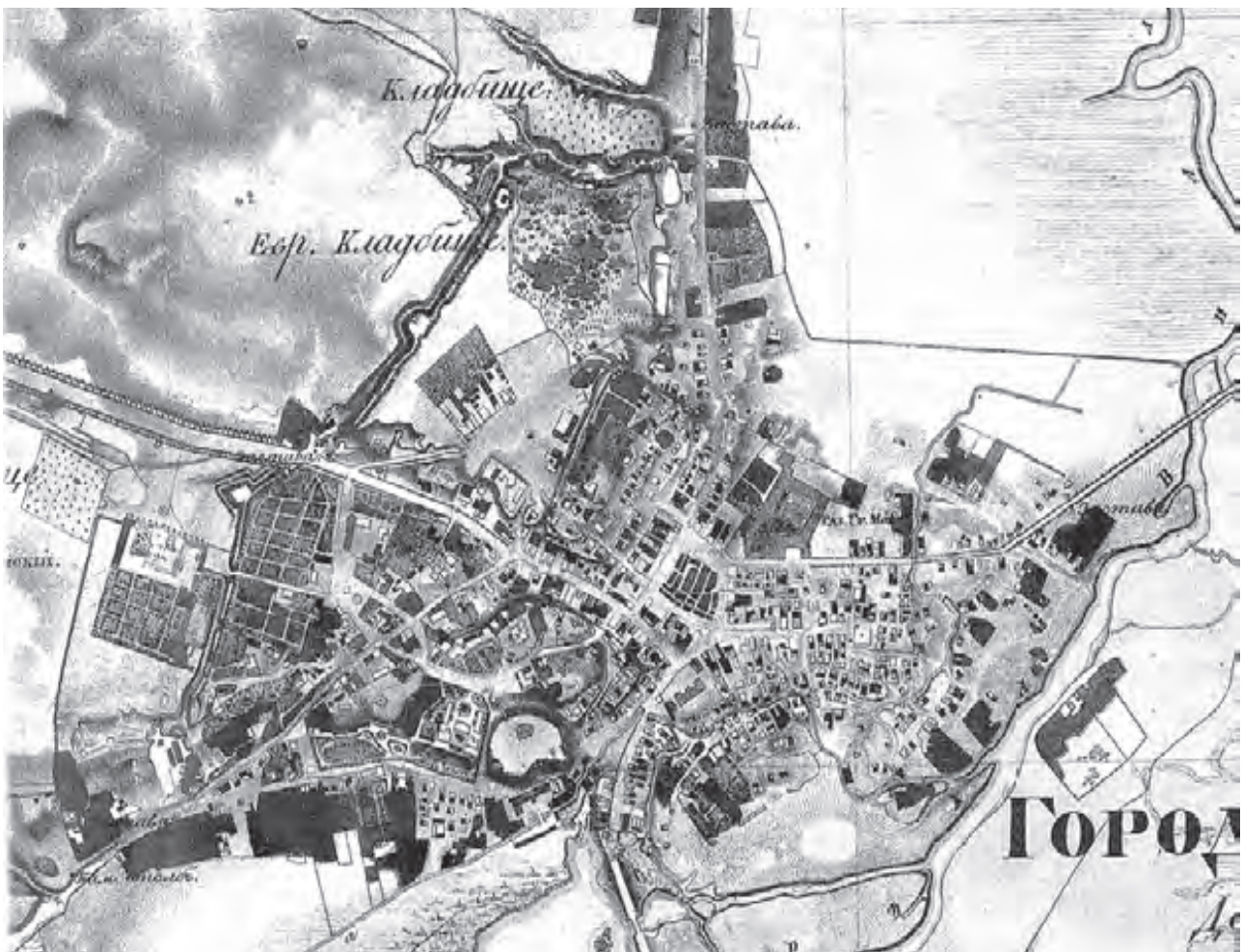
Рис. 5. «Топографический план Волынской губернии города Острога, снятый под руководством капитана Стефана». 1833 р.

Водночас декілька споруд передбачалося знести. Згідно легенди це мали бути кам'яні стіни, що залишилися після пожежі колишнього кармелітського монастиря, торгівельні лавки на території ринкової площі, а також обидві (!) муровані брами – Луцька та Татарська. На щастя, брами уціліли.