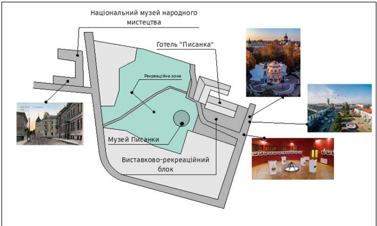
Рис. 3. Комплекс музеїв писанкового розпису в м. Коломиї