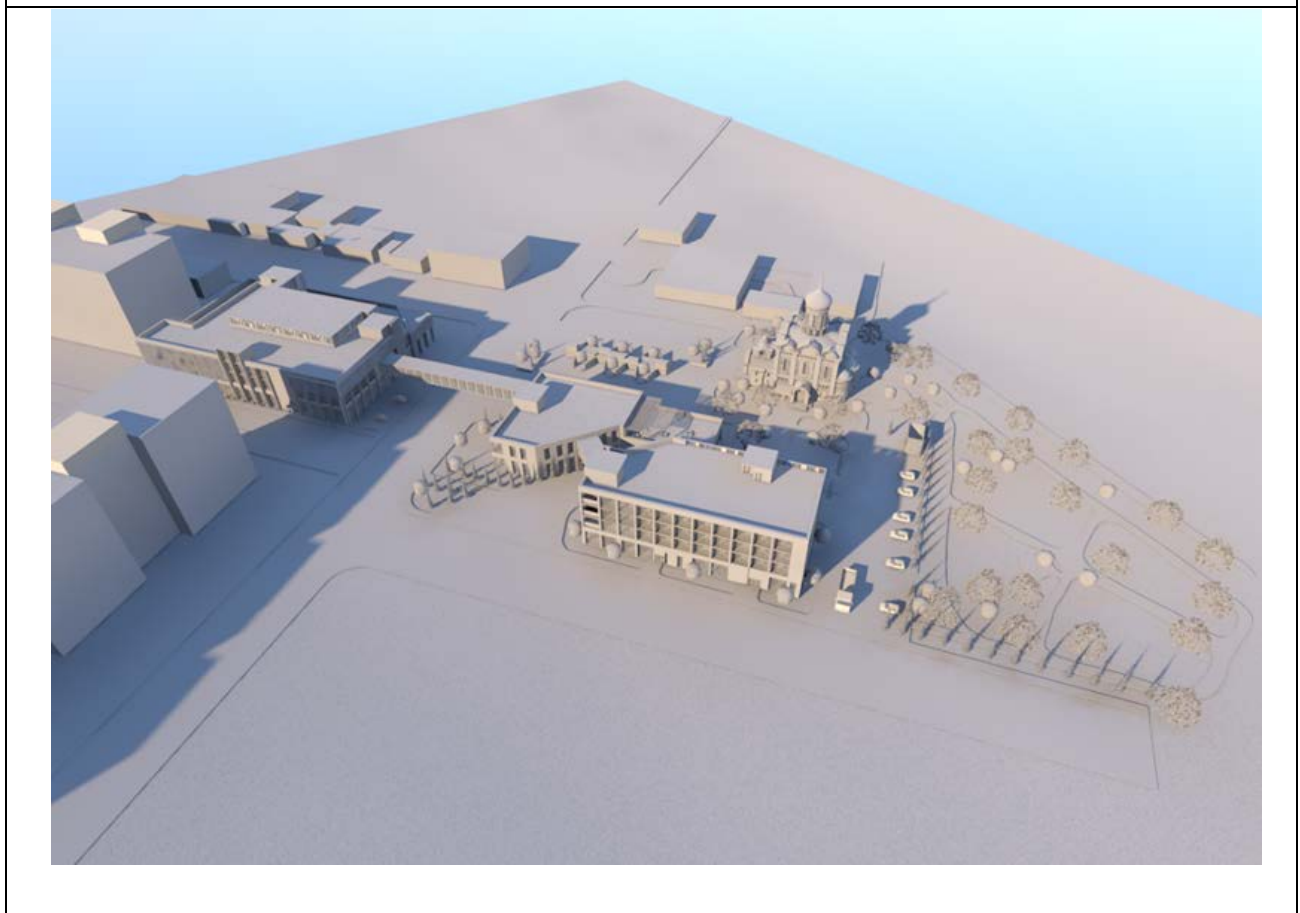
Рис. 4. Проектна пропозиція культурно-просвітницького комплексу в м. Костопіль (розроблено магістром Сидорчук Н.О. під керівництвом проф. Ковальської Г.Л.)