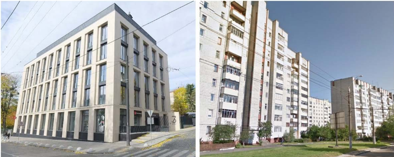
Рис.2. а – Житловий комплекс «Avalon» на вул. Личаківській, б – Житлові будинки на вул. Сяйво (фото автора)

До групи культурних чинників впливу на формування медійності архітектури та просторів міста належать звичаї і традиції , характерні для конкретного місця проектування. Вони наповнюють середовище унікальним сенсом для об'єднують його мешканців. Для Львова важливе значення мають релігійні свята та пов'язані із ними звичаї і традиції. Тож простір міста адаптують до цих потреб за допомогою різноманітних елементів оздоблення [17]. Наприклад, у різдвяний час фасади прикрашають святковими декораціями, ставлять дідуха, проводять ярмарки, повсюди лунають колядки та щедрівки. Все це наповнює міський простір святковою атмосферою та віддає шану українським звичаям і традиціям. Однією із зимових традицій є встановлення ялинки в центрі міста перед Оперним театром. У 2023 році медійність центральної ялинки набула особливого змісту,. Ялинку прикрасили мінімалістичними гірляндами, а її верхівку замість звичної зірки увінчує протитанковий «їжак» (рис.3), що одразу викликає асоціації із війною, яка триває в Україні [15].