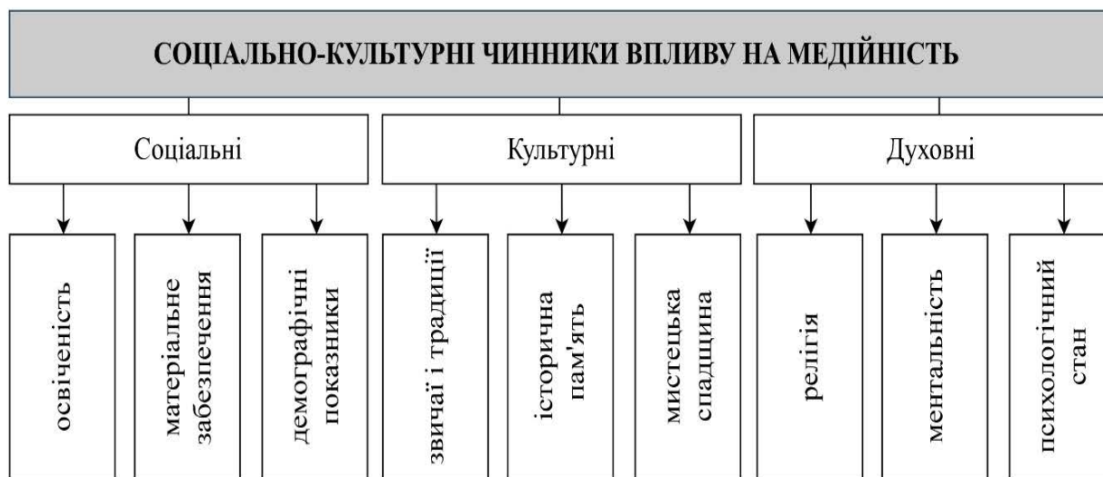
Рис.1. Класифікація соціально-культурних чинників впливу на формування медійності архітектури та просторів міст

вносяться на громадське обговорення, залучаючи таким чином львів'ян до архітектурного процесу.