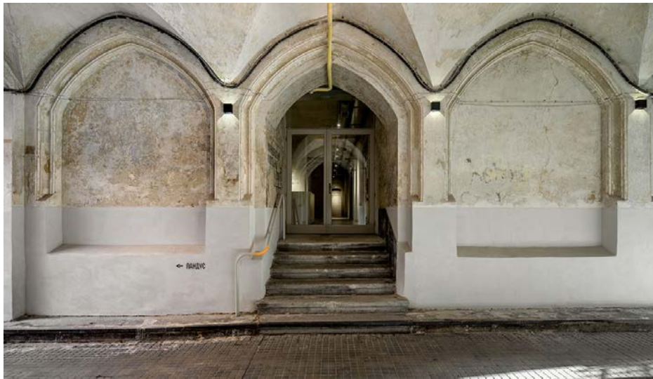
Рис.5. Вхід у Львівський муніципальний арт-центр на вул.Стефаника

попрацювати чи випити кави в оточенні мистецтва. Прикладом є Львівський муніципальний мистецький центр (рис.5).