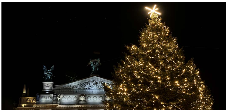
Рис.3. Центральна ялинка у Львові у 2023 році

До групи культурних чинників впливу на формування медійності архітектури та просторів міста належать звичаї і традиції , характерні для конкретного місця проектування. Вони наповнюють середовище унікальним сенсом для об'єднують його мешканців. Для Львова важливе значення мають релігійні свята та пов'язані із ними звичаї і традиції. Тож простір міста адаптують до цих потреб за допомогою різноманітних елементів оздоблення [17]. Наприклад, у різдвяний час фасади прикрашають святковими декораціями, ставлять дідуха, проводять ярмарки, повсюди лунають колядки та щедрівки. Все це наповнює міський простір святковою атмосферою та віддає шану українським звичаям і традиціям. Однією із зимових традицій є встановлення ялинки в центрі міста перед Оперним театром. У 2023 році медійність центральної ялинки набула особливого змісту,. Ялинку прикрасили мінімалістичними гірляндами, а її верхівку замість звичної зірки увінчує протитанковий «їжак» (рис.3), що одразу викликає асоціації із війною, яка триває в Україні [15].