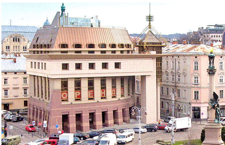
Рис. 6. Будівля банку на пл.Міцкевича у Львові

Контакт людини з інформаційним середовищем викликає певне емоційне забарвлення. Цей аспект часто використовують у соціальній психології впливу [20]. Емоції, які виникають під час перебування в певному середовищі, супроводжують його семіотичне розуміння і формують феноменологічне значення щодо окремих архітектурних об'єктів або цілих частин міста [6]. Як приклад розглянемо будівлю банку на площі Міцкевича, збудовану у 2005 році за проектом Олександра Базюка (рис.6). Новозбудований об'єкт був дуже контрастним по відношенню до історичного середовища, що викликало обурення у мешканців. Його піддавали нищівній критиці за специфічну форму і оздоблений блискучою плиткою фасад, створивши низку неприємних асоціацій. Через це будівля отримала погану репутацію і донині її зберігає, незважаючи на те, що на сьогодні банк виглядає досить звично у центрі міста.