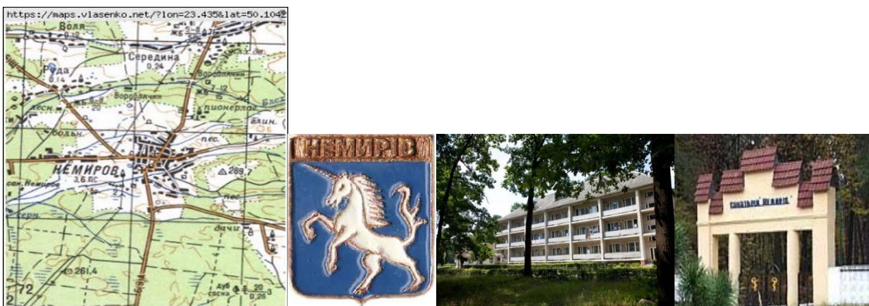
Рис.1. Фото: карта Немирова; герб Немирова; історичні об'єкти санаторію «Немирів».

Розміщення та архітектурно-просторова організація рекреаційної системи безпосередньо визначаються особливостями природно-ландшафтних характеристик території з врахуванням історичних, культурно-етнографічних та інших особливостей. Нині курорт Немирів розкинувся на території 12 га у мальовничому сосново-листяному лісопарку на висоті 220 м над рівнем моря у рівнинній місцевості, за 18 км від районного центру Яворова і 10 км від пункту пропуску Будомеж-Грушів на кордоні з Польщею. Рекреаційній сфері притаманні риси динамічності і високоприбутковості, - і в цьому беззаперечна їх перевага та актуальність інтенсифікації використання. Інфраструктура курорту Немирова співзвучна з його специфікою і медичним профілем - бальнеологічний комплекс орієнтований на відпочинок та лікування [рис.1].