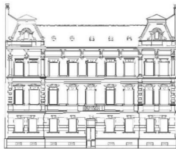
Рис. 4. Необароко. Фасад прибуткового будинку за адресою Ковжуна, 5 (1894 р.)