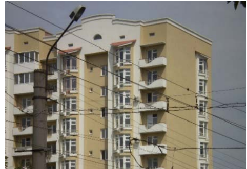
Рис. 10. Житловий будинок за адресою Мазепи, 29

Архітектурний розвиток Львова ХХ ст. характеризується тісним взаємозв'язком нових ідей та творчістю періоду класицизму, історизму, модерну. Досвід архітекторів у ХХ ст., пов'язаний з історичним минулим, свідчить про значення і місце архітектури кінця ХVІІІ – початку ХХ ст. для подальшого розвитку і забудови міста.