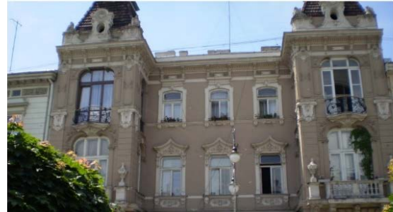
Рис. 7. Житловий будинок на проспекті Шевченка у Львові