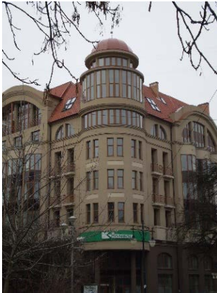
Рис.8. Житловий будинок за адресою Валова, 15

будинки (Валова, 15 (Рис. 8), Богуна, 6, Очаківська, 1(Рис. 9), Мазепи, 29 (Рис.10), Сахарова, 21, Личаківська, 159). Сучасні архітектори поєднують новітні художні мотиви з класичними деталями, в окремих випадках детально відтворюють елементи ренесансу, готики, бароко, модерну, звертаються до історичного досвіду.