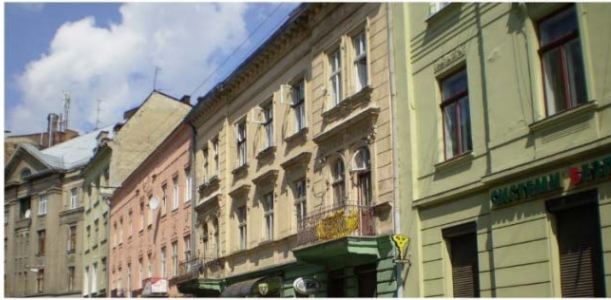
Рис. 6. Забудова вулиці Наливайка у Львові

Архітектура житлових будинків набуває різноманітності завдяки використанню архітектурних деталей бароко, готики, ренесансу у певній інтерпритації камерних львівських вуличок. В кінці XIX ст. можна було побачити цікаві елементи на фасадах будинків, що вже впливали на акцент у сприйнятті цілої вулиці – еркери, ризаліти, шпилі на дахах.