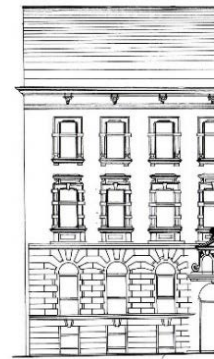
Рис. 5. Неоренесанс німецький. Фрагмент фасаду прибуткового будинку за адресою Бандери, 9 (1898 р.)

Середина XIX ст. виділялась іншим стилевим напрямком, метою якого було створення раціональної архітектури, видобувати з будівельного матеріалу його природні властивості, в цьому випадку цегли. Провідним архітектором цього напрямку був австрієць Т. Гансен. Формотворчі періоди класицизму та історизму відкрили нові ракурси для розвитку наступного стилю, модерн постає багатограним та органічним продовженням історизму. В архітектурі модерну безпосередньо збереглися принципи пропорцій та композиційних вирішень фасадів, вкорінені ще в XIX ст. В цей період крім архітекторів, які навчалися у Відні та Львові, також тут працювали видатні випускники берлінської школи: Юліан Гохбергер, Мацей Морачевський, Зигмунд Горголевський [5].