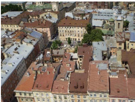
Рис. 1. Забудова центральної частини Львова

Простежити за композиційною та стильовою структурою найстарішої забудови, можна завдяки збереженим кам'яницям на площі Ринок та сусідніх з нею вулицях. Фасади будинків були частіше тривіконні, рідше чотири та двовіконні (вул. Староєврейська, 38 і 50). Особливість тогочасних будівель – асиметричне розміщення вікон на фасадах, зумовлене внутрішньою структурою [7]. Для окремих будинків були характерні урівноваженість композиції, горизонтальне членування, що притаманні таким творам епохи ренесансу та раннього бароко, як кам'яницям кінця XVI ст., початку XVII ст. за адресами пл. Ринок, 2, пл. Ринок, 21, пл. Ринок, 28 [7]. В цей період не спостерігається яскравих акцентів на фасадах (Рис. 1). Вулиці створювались ритмічним розташуванням будинків з монохромним повторенням класичних архітектурних деталей – надвіконні сандрики, карнизи, рустування поверхів. Центральна частина Львова і надалі зберігає найстарішу забудову, продовжує своє активне життя як туристичний осередок. Тут відбуваються реновації існуючих будівель, облаштування їх для сучасних потреб. Переважно це вирішення нових готелів, ресторанів для покращення обслуговуючої інфраструктури – облаштування екстер'єрів наближених до існуючої забудови ренесансових вулиць, в той час як розпланування будівлі та інтер'єр є сучасними та комфортними (Рис.2).