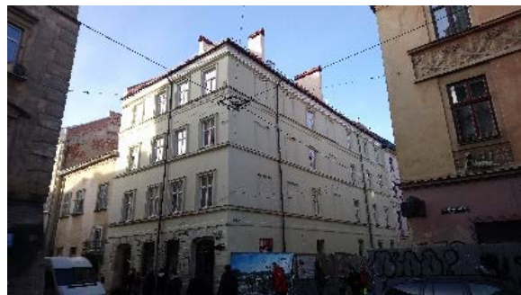
Рис. 2. Будинок на розі вулиць Вірменської та Друкарської у Львові (перебудова житлового будинку для влаштування готелю)