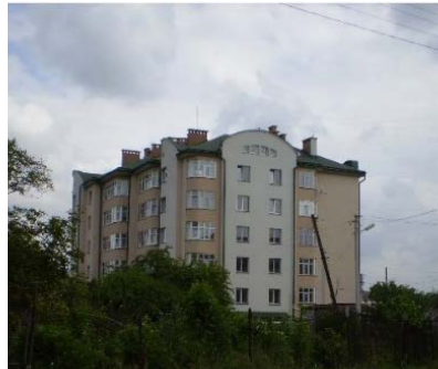
Рис.9. Житловий будинок за адресою Очаківська, 61