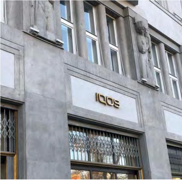
Рис. 2. Гармонійна інтеграція комерційних елементів дизайну міста Львова