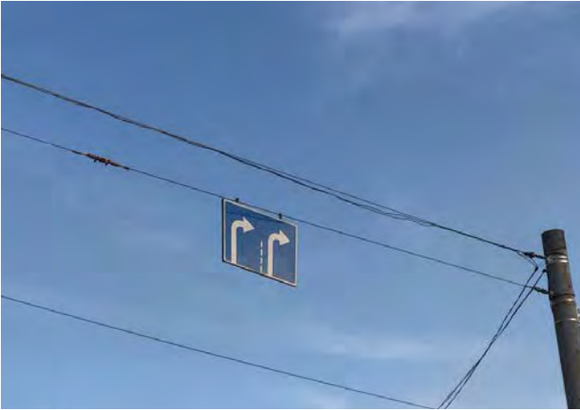
Рис. 12. Підвісні дорожні знаки