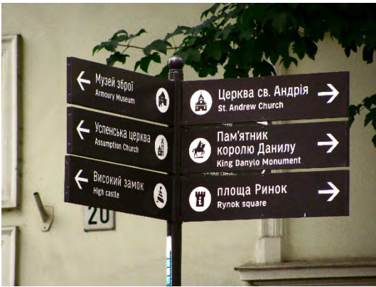
Рис. 4. Вказівники з напрямками до пам'яток