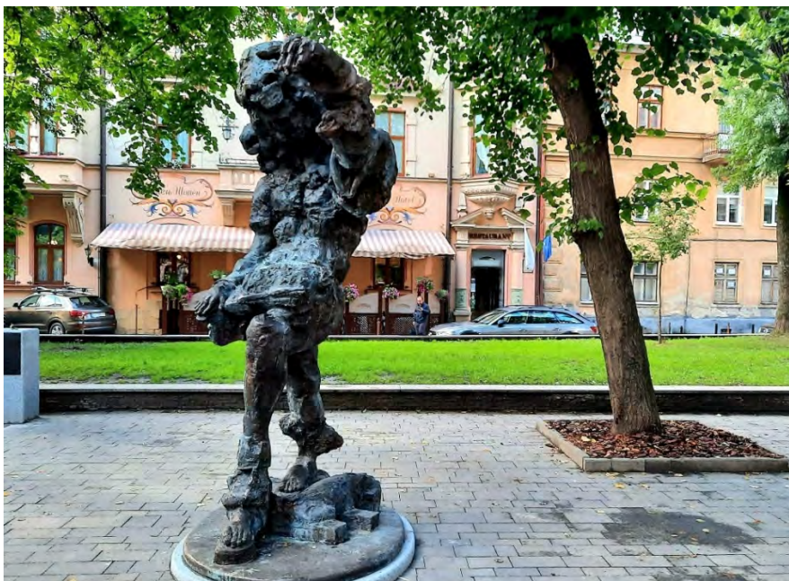
Рис. 7. Пам'ятник Францу Ксаверу Моцарту на пл. Маланюка у Львові

3) Соціально-комунікативні : елементи медійності, що забезпечують обмін інформацією. У цій групі варто виділити об'єкти, які безпосередньо передають інформацію (розклад руху транспорту, екран з новинами, меморіальні таблиці), та об'єкти з прихованою інформативністю (пам'ятники, стели, постаменти). Особливу увагу варто приділити останнім, адже вони наповнені найглибшим семантичним змістом та найчастіше стають об'єктами громадських дискусій. Наприклад, нещодавно встановлений у на площі Маланюка у Львові пам'ятник Францу Ксаверу Моцарту (рис.7).