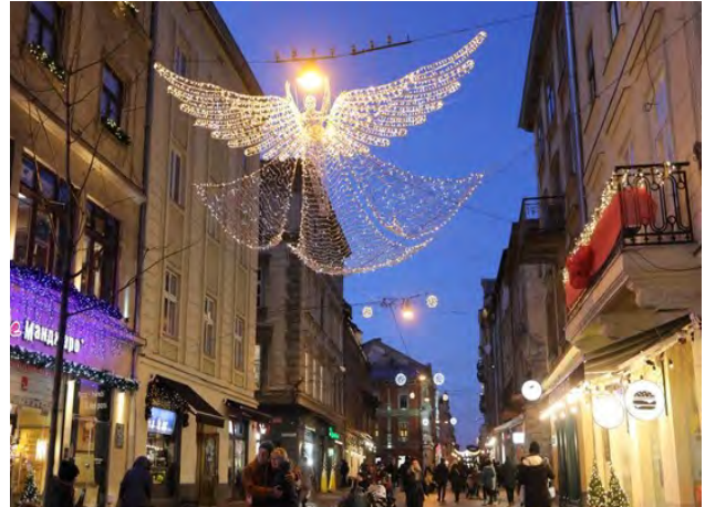
Рис. 13. Підвісні святкові декорації

Проаналізувавши існуючі елементи дизайну міського середовища, можемо здійснити оцінку за характерними ознаками при їхньому застосуванні в архітектурному середовищі міста.