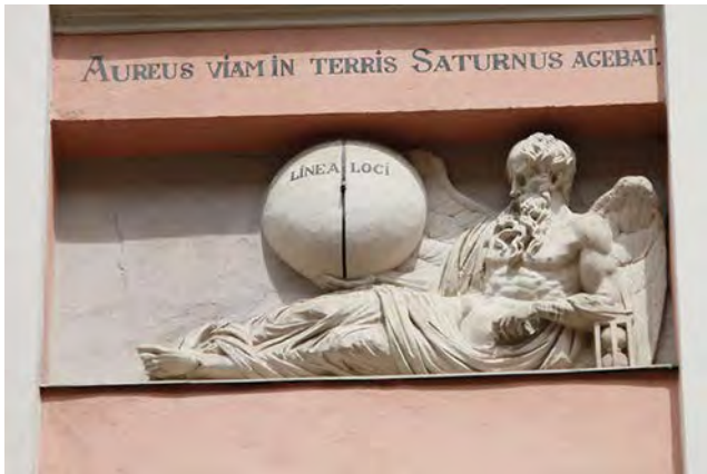
Рис. 10. Сонячний годинник на фасаді будинку на вул. Вірменській, 23