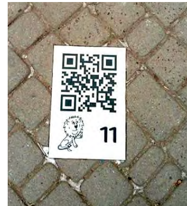
Рис. 6. Екскурсійний QR-код на тротуарі

3) Соціально-комунікативні : елементи медійності, що забезпечують обмін інформацією. У цій групі варто виділити об'єкти, які безпосередньо передають інформацію (розклад руху транспорту, екран з новинами, меморіальні таблиці), та об'єкти з прихованою інформативністю (пам'ятники, стели, постаменти). Особливу увагу варто приділити останнім, адже вони наповнені найглибшим семантичним змістом та найчастіше стають об'єктами громадських дискусій. Наприклад, нещодавно встановлений у на площі Маланюка у Львові пам'ятник Францу Ксаверу Моцарту (рис.7).