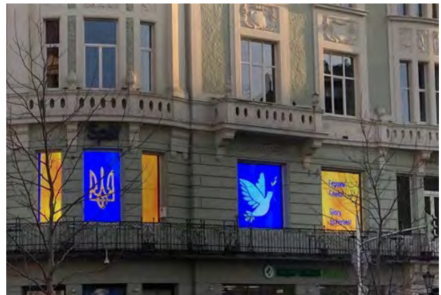
Рис. 11. Медійний екран на фасаді будинку проспекту Свободи