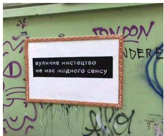
Рис. 9. Графіті на вул. Вірменській