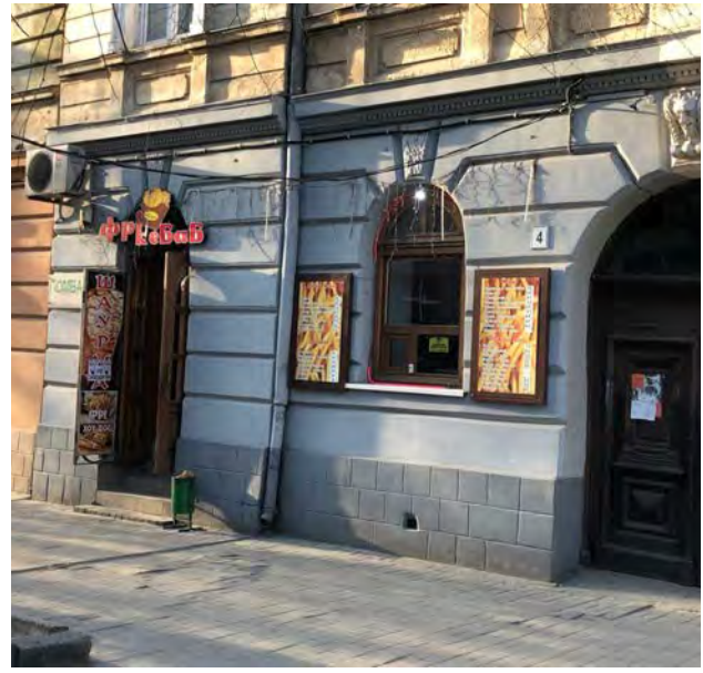
Рис. 3. Деструктивна інтеграція комерційних елементів дизайну міста Львова

2) Навігаційні : елементи дизайну, що створені для орієнтування людини у просторі. Потреба у системі вказівників виникла ще у давні часи, коли первісна людина, йдучи на нові території, позначала свій шлях, щоб не загубитися і повернутися назад. Тому для того, щоб комфортно почуватись у просторі, особливо якщо це нове для нас місце, нам необхідно бачити вказівники. У сучасному місті вони набувають різноманітних форм: таблички з назвами вулиць чи площ, дорожні знаки, розмітка, навіть світлофори. Для зручності туристів вулиці Львова оснащено вказівниками на різних мовах, що скеровують до історичних пам'яток (рис.4), у кількох точках центральної частини міста розміщено туристично-інформаційні стенди (рис.5). У 2017 році у центрі Львова з'явився інноваційний пізнавальний маршрут за допомогою 15 табличок на тротуарах із QR-кодами (рис.6). Це екскурсія, яка за допомогою смартфона допоможе туристу орієнтуватись у місті та отримати базову інформацію про об'єкти та послуги Львова.