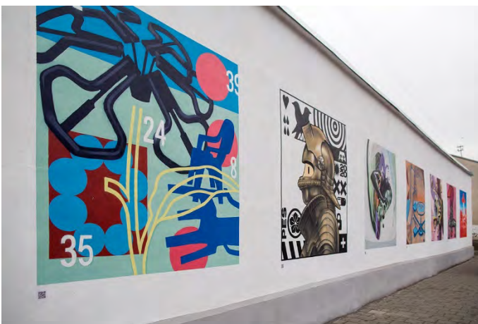
Рис. 8. «Вулична галерея» стріт-арту на вул. Замарстинівській

На жаль, далеко не всі «художники» мають на меті творити мистецтво, а перетворюють графіті на звичайний вандалізм. Їх жертвами стають щойно помальовані стіни, відреставровані двері, вітрини магазинів тощо. Медійність у цьому випадку можна трактувати як бажання самовираження, як протест проти теперішніх суспільних цінностей. Однак це не виправдовує руйнівний характер цих малюнків. Дивлячись на такі примітивні графіті, що переповнюють місто, не можна не погодитись з надписом, який з'явився на вул. Вірменській: «Вуличне мистецтво не має жодного сенсу» (рис.9).