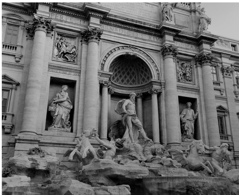
Рис.2. Фонтан Треві у Римі як зразок виявлення бароко у громадському просторі

Одним з елементів медійності міського простору можна назвати фонтан Треві у Римі – знаменитий взірець італійського бароко (рис.2). Нікола Сальві, архітектор фонтану, надихнувся ідеєю Папи Урбано VIII, який вважав, що архітектура і скульптура повинні розповідати історію, тож вирішив встановити пам'ятник «асqua vergine» (італ. – «незайманій воді») і увіковічити історію римського акведука. Темою композиції стало море. Розроблений на подібні триумфальної арки з глибокою нішею, фонтан плавно спускається до широкого басейну. По центру знаходиться велика скульптура Посейдона, який керує упряжкою в формі мушлі з морськими конями та тритонами. По боках фонтан обрамлено скульптурами, що розповідають історію акведука, а також алегоричними фігурами, пов'язаними з цілющими властивостями води.