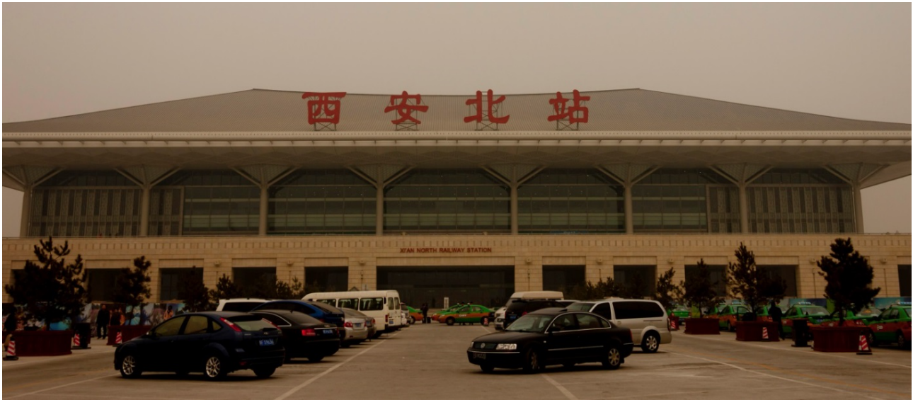
Рис.4. Північний вокзал м. Сіань за зразком модифікованого храмового павільйону.

Досвід Китаю свідчить про те, що найчастіше взірцями наслідування стають саме такі уніфіковані будівлі, які можуть бути легко пристосовані під різні громадські функції (Рис.4).