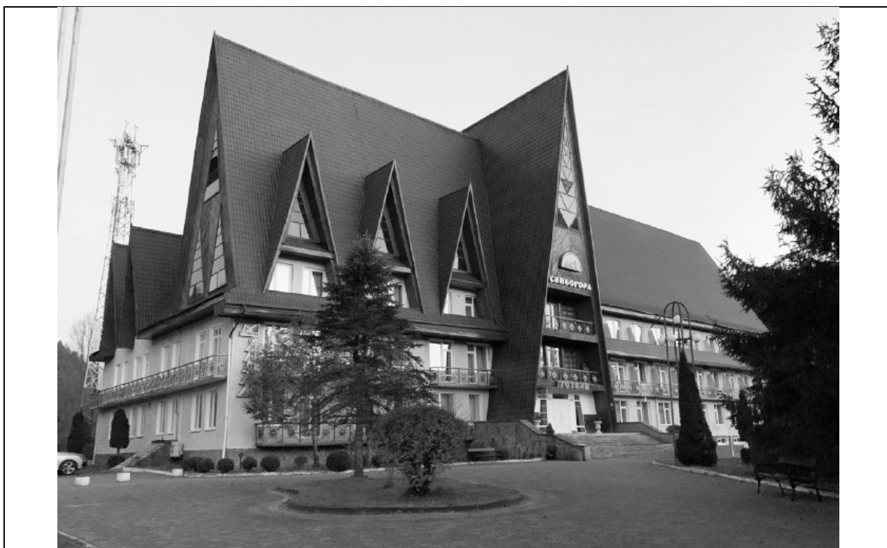
Рис. 1. Готель «Синьогора».

На території організації розташовано готель «Синьогора» (рис.1) на 84 ліжко-місця, в якому облаштовано номери класу «люкс», «апартаменти», «напівлюкс» - це двомісні та чотиримісні номери, 6 комфортних котеджів на 22 особи. У готелі розташований банкетний зал – бар на 120 місць, їдальня – 100 місць, два конференц-зали: на 20 та 60 чол., зал прийомів – 20 місць; оздоровчо-лікувальний комплекс із сауною, басейном, тренажерним залом, більярдом, тенісом, ваннами підводного масажу, ванною з трав.