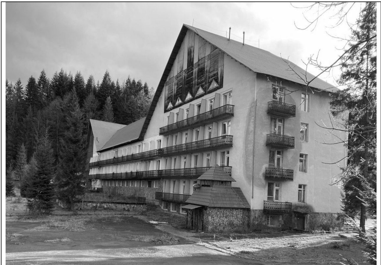
Рис. 2. Санаторій «Гута» (фото з домашнього архіву автора)

База складалась з основного корпусу, кількох котеджів та величезного спортивного корпусу з ігровими майданчиками, тренажерами та басейном. На території також було футбольне поле, озеро та власна пожежна частина, яка функціонує і досі.