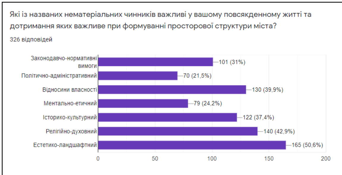
Рис. 2. Результати моніторингу важливості конкретного нематеріального чинника у просторовій структурі міста

У нашому дослідженні використовувався рейтинговий метод, який дозволив сформувати своєрідну ієрархію нематеріальних чинників. Єдиний ризик в цьому плані полягає в тому, що більшість респондентів не є фаховими архітекторами, а тому вони не розуміли глибини змісту окремих нематеріальних категорій. Для прикладу більшість людей важко розмежовували законодавчо-нормативні вимоги та політико-адміністративні чинники, вважаючи їх один і тим же. Це на нашу думку є свідченням низького рівня правової свідомості та правової культури населення і ще більше аргументує потребу посилення вивчення впливу нематеріального на просторову структуру.