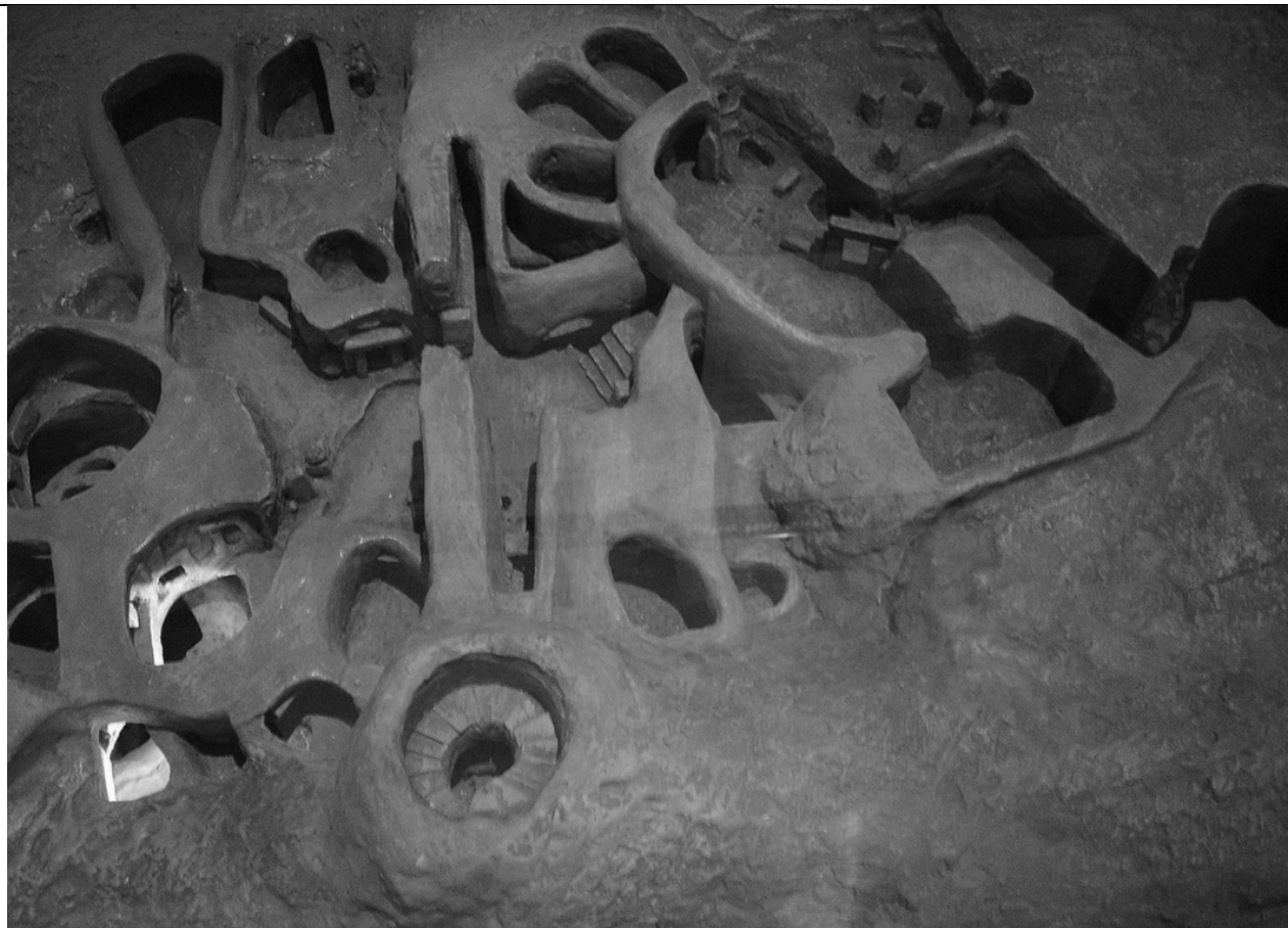
Рис 3. Модель гіпогею з основними приміщеннями, 4000 р. до н. е.

Висновок: Отже, з'ясовано, що сакральна архітектура відіграє особливу роль у великій творчій діяльності Річарда Інгланда.