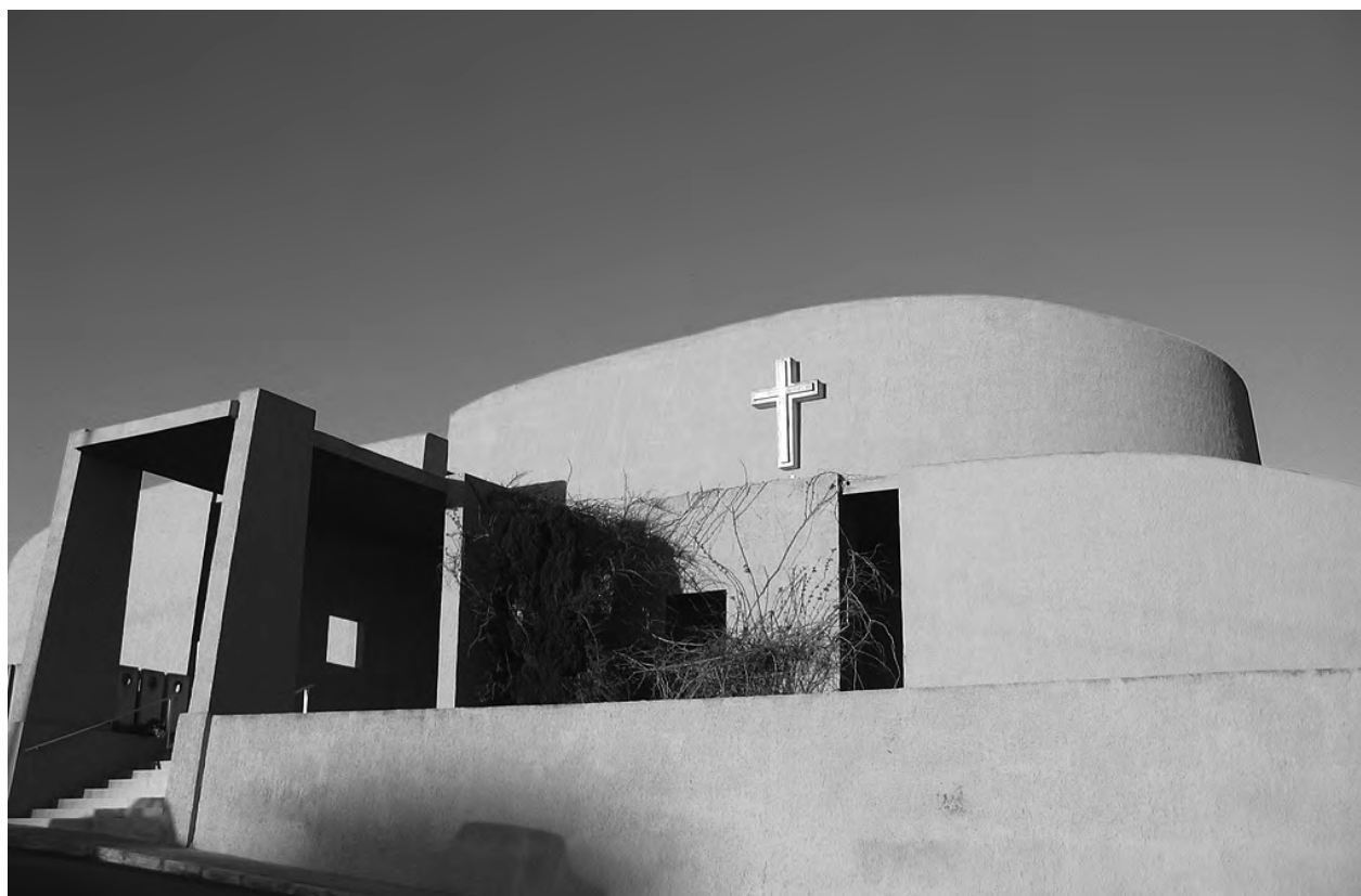
Рис 1. Храм св. Йосипа, с. Маніката, Мальта. Річард Інгланд, 1961