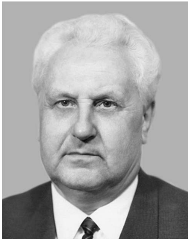
Павло Бакума (1911–1987) — президент Академії будівництва і архітектури УРСР у 1959–1963 роках

Якщо вдуматися в останню фразу тричі, особливо в «комуністичний зміст громадських процесів», має запрозоритись, чому цей красномовець добре тримався в президентському кріслі з 1960 по 1963 рік, і сидів би в ньому, наче Зевс у Парфеноні, вічно, якби не ліквідація Академії в серпні 1963-го.