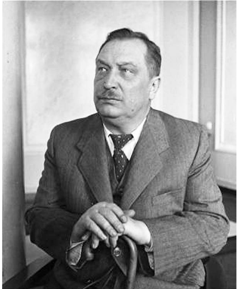
Володимир Заболотний (1898–1962) — президент Академії архітектури Української РСР у 1945–1955 роках

Затвердити статут, структуру, визначити кількість перших академіків (сім) і членів-кореспондентів (вісімнадцять), затвердити їх поіменно, зобов'язати «подати на розгляд Раднаркому УРСР через Нарком фін УРСР кошторис витрат за всіма статтями на 1945 рік», а також зобов'язати АА УРСР прийняти від АА СРСР Українську філію АА СРСР «з усіма наявними закладами, штатами співробітників, устаткуванням, інвентарем, приміщеннями,