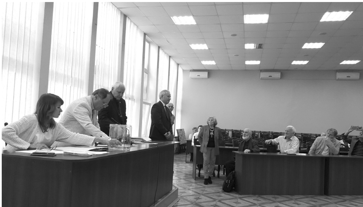
Загальні збори Української академії архітектури в залі засідань Вченої ради КНУБА 14 вересня 2021 року Виступає новообраний президент УАА акад. О. С. Слепцов

Порядок денний Загальних зборів 14.09.2021 містив два питання: звіт президії Академії та обрання нового президента УАА.