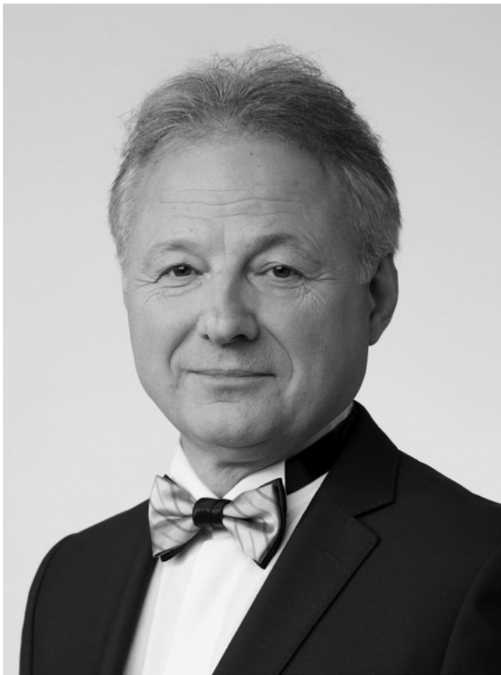
Олег Слепцов (н. 1958) — президент Української академії архітектури з вересня 2021 року

Наразі перед Академією знову постають як внутрішньо-організаційні (поновлення Статуту, обрання президії, віцепрезидентів, головного вченого секретаря Академії, керівників відділень, нових членів УАА тощо), так і