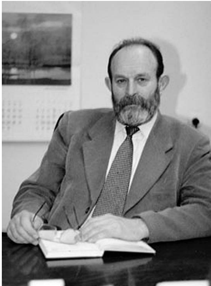
Валентин Штолько (1931–2020) — президент Української академії архітектури у 1992–2020 роках

Президентом УАА 1992 року був обраний академік УАА, лауреат Державної премії СРСР, Національної премії України імені Тараса Шевченка, Державної премії України в галузі науки і техніки, Державної премії України в галузі архітектури, Республіканської премії ЛКСМУ імені М. Островського, народний архітектор України, доктор архітектури, професор Валентин Штолько (1931–2020), який виконував ці обов'язки до останньої миті життя; головним ученим секретарем став академік УАА, заслужений архітектор України, доктор архітектури, професор Дмитро Яблонський (1921–2001). 1997-го головним ученим секретарем був обраний академік УАА, доктор технічних наук, професор Євген Ключниченко (1939–2021).