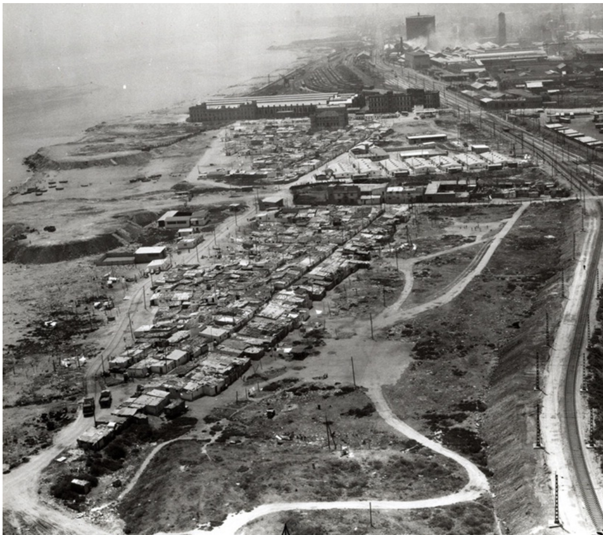
Рис. 3. Барселона. Стан приморських територій міста в середині 20-го століття. Можна спостерігати залізницю та промислові території, які слугують бар'єром між містом й морем.

До неспортивної спадщини мегаподії можна віднести Олімпійські селища (за Посацьким Б. та Ідак Ю.) [26], Олімпійське селище - це цілісний комплекс будівель і споруд, доступ до якого мають лише спортсмени, тренери, офіційні делегації й інші співробітники, а також члени сімей та колишні олімпійські атлети), медіа центр, оновлені транспортну інфраструктуру й громадські та паркові простори, міське середовище тощо.