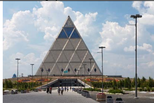
Рис. 4. Дворец мира и согласия, г. Астана, Казахстан, арх. Норман Фостер, 2006

Храм Гроба Господнего в Иерусалиме (Израиль) сегодня может быть примером совместного использования культового сооружения различными христианскими конфессиями. Храм всех наций в Иерусалиме (Израиль) (см. Рис. 2) построен в 1924 году при финансовой поддержке 12 католических стран мира. Церковь принадлежит католикам, но прочие христианские конфессии также могут проводить здесь свои богослужения.