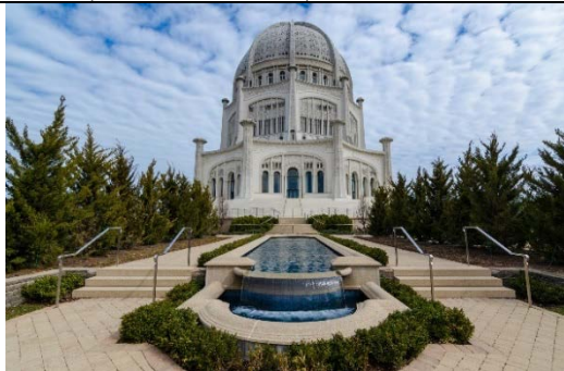
Рис. 3. Храм всех религий, г. Чикаго, США, арх. Жан-Батист Луи Буржуа, 1953