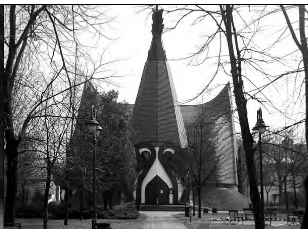
Рис 2. Імре Маковеч, церква в Сіофоку, фасад, 1985–1990