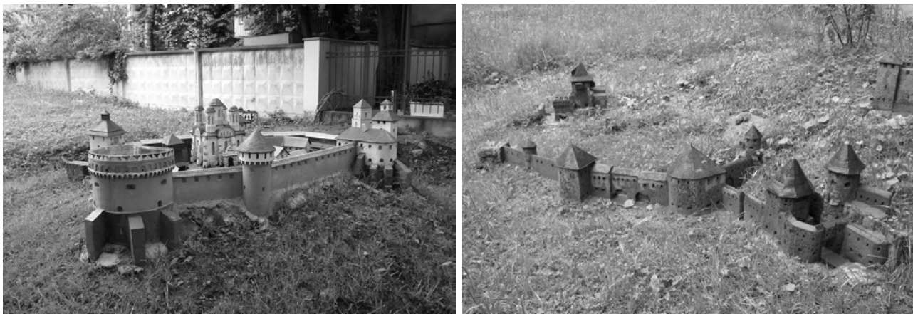
Рис.4. Парк замків та оборонних споруд давньої України. м. Львів, Україна

Проаналізувавши процес створення архітектурних мініатюр відомих світових парків, можна виділити основні принципові етапи технологічного процесу: