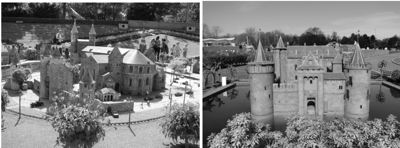
Рис.2. Парк мініатюр Madurodam. м. Гаага, Нідерланди

Спочатку парки мініатюр отримали популярність лише у Великобританії, але після Другої світової війни вони стали з'являтися і в континентальній Європі. Одним з перших парків мініатюр на континенті став - «Мадуродам» ( Madurodam) в Нідерландах, відкритий в 1952 році. На його рахунок зараз налічується більше 700 моделей на площі 6,2га [3] (Рис.2).