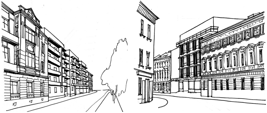
Рис. 2. а) Житловий будинок на вул. І.Огієнка; 4; б) Салон-перукарня на вул. І.Франка, 23.

які перетинаючись з ребрами формують активний малюнок фасаду . Новий будинок дещо не масштабний сформованому оточенню через вивищення на поверх над сусідами та досить жорстку архітектурну форму завершення будівлі – високий парапет . Використаний характерний для оточення прийом виділення першого поверху, хоча й іншими засобами. В новій будівлі це стрічкове за-скленні вітрин та дашок над вітринами, в старих сусідніх будинках – руст. Разом з цим, згадувані уже вертикальні ребра та горизонтальні тяги, які пересікаються з ними, створюють пластично активні хрестоподібні пересічення, чужі оточенню та надаючи новій будівлі неоправдану контрастність. До позитивних рис композиції об'єму нового будинку слід віднести відступ фасаду в глибину від існуючої лінії забудови, що дозволяє візуально зменшити висоту будівлі.