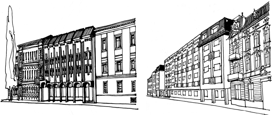
Рис. 4. а) Салон автомобілів на вул.Чайковського, 20; б) офісний будинок на вул.І.Франка, 33.

Салон автомобілів на вулиці Чайковського, 20 побудований у 1986 р. за проектом М. Трача (рис.4а). Об'єм нової будівлі співрозмірний оточенню, будинок дещо відступає від існуючої лінії забудови, що є логічним для вузької вулиці. Можна вважати, що пластика нового фасаду в цілому пов'язує досить насичений фасад будинку зліва з простим рішенням фасаду будинку справа в загальному фронті вулиці. Малюнок фасаду вставки ґрунтується на вертикальному членуванні площини фасаду (сумірних фасаду будинку зліва) і такому ж членуванню покрівлі. Заслужує уваги об'ємна інтерпретація архітектурних форм, розміщених ніби в трьох площинах. Перша з них – найбільш виступаючі елементи дашка першого поверху та вінчаючий карниз. Друга – площина стіни другого та третього поверхів та половини першого. Третя – втоплена площина застібання першого поверху та гребінь розвинутого карнизу. Зауважимо також, що пропорції прорізів близькі навколишній забудові. Хоча ці будівлі розділяє майже десятиліття, але в обох випадках можна говорити про доповнення та розвиток композиції сформованого середовища. Дещо інша картина спостерігається на ділянці вулиці Ів.Франка, 33, де побудовано офісний будинок (архітектори В. Суц, А., Симбірцева, 1983 р.) (рис.4б).