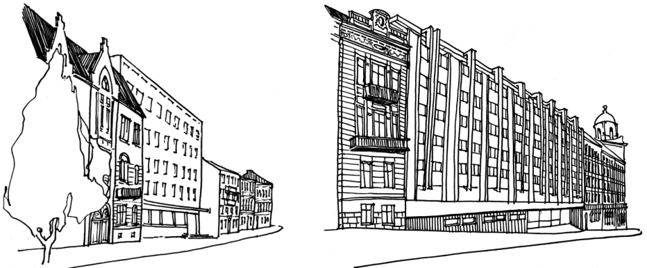
Рис.3. а) Офісна будівля на вул. Вітовського, 20. б) Офісна будівля на вул. Листопадового Чину, 22

Прикладом може служити композиція фасаду офісної будівлі на вулиці Листопадового Чину, 22 за проектом Р. Сивенького у 1978 р. (рис.3б). Для фасадів сусідніх будинків початку ХХ століття є характерним крупний масштаб (особливо будинок справа) фасадів, різноманітний декор, переважання вертикальних елементів. Протилежний бік вулиці не забудований (територія парку), що створює різноманіття точок сприйняття нового об'єкту. Очевидно, вказані особливості ділянки багато в чому визначили композицію фасаду нового будинку та його взаємозв'язок з оточенням. Об'єм вставки у цілому сумірний сусідам, в формах фасаду підкреслені вертикальні елементи, що створюють чіткий, досить подрібнений ритм. Горизонтальні пропорції віконних прорізів, здавалось би, контрастують з вікнами сусідніх будинків, однак організуючою ознакою тут є не геометрія прорізу, а пропорції рам. Аналогічно до сусідніх фасадів активно виділений перший поверх, хоча і іншими засобами – горизонтальним поясом, поєднанням стрічкового застосування з невеликими вікнами з обрамленнями. Верхній поверх відступає від головної площини фасаду, що візуально пов'язує його з шатровими дахами сусідніх будинків.