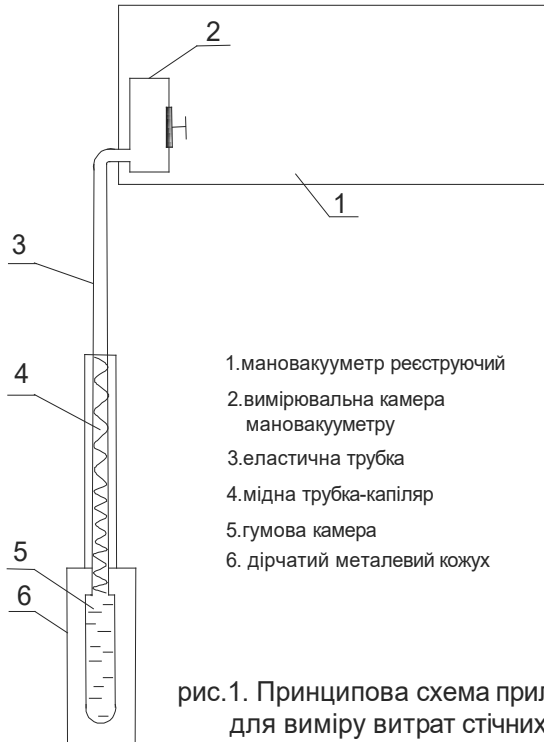
рис.1. Принципова схема приладу для виміру витрат стічних вод

Для виміру витрат на каналізаційних колекторах був сконструйований компактний і мало енергоємний прилад реєстрації пропускної здатності ділянок мереж водовідведення, який здатен працювати в умовах підвищеної вологості в агресивному середовищі (в середині колодязів на мережах водовідведення). Для таких умов роботи був створений прилад, основними елементами якого є сприймаючий елемент та мановакууметр реєструючий (рис.1).