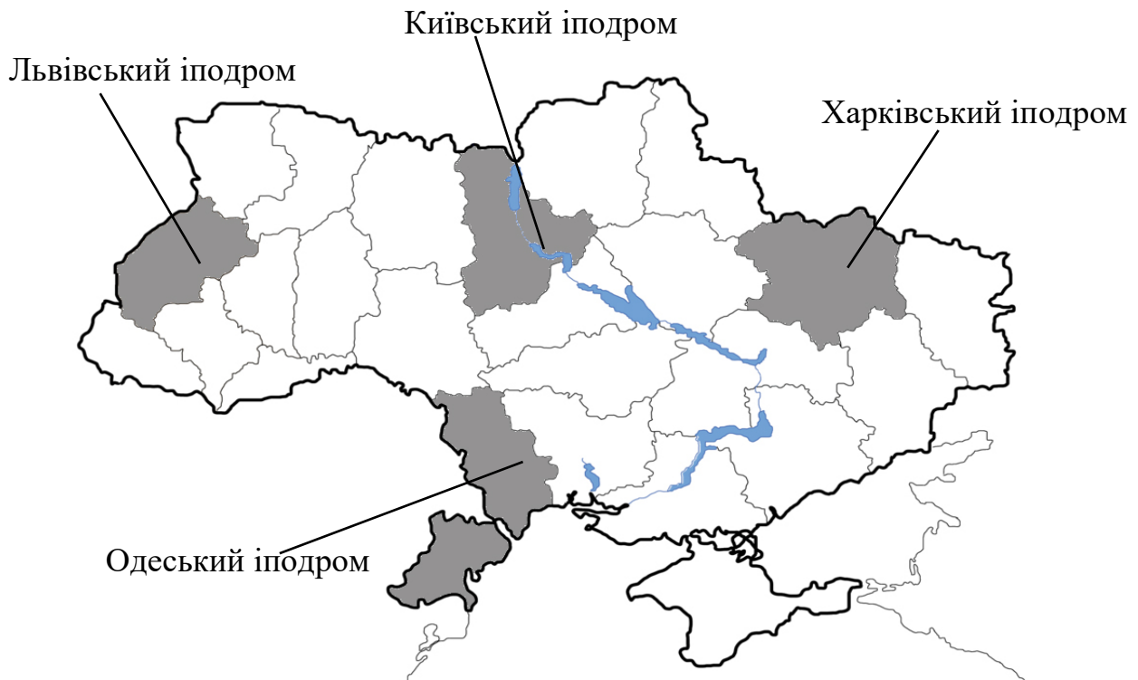
Рис. 1.2. Іподроми України з функцією іпотерапії

Київський, Львівський, Одеський, Харківський, де утримують коней, проводять кінні спортивні змагання та супутньо впроваджено функцію іпотерапії рис. 1.2, табл. 1.1.