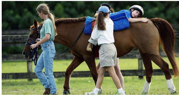
Рис. 1.1. Застосування іпотерапії

Іпотерапія – це лікування за допомогою верхової їзди на коні під наглядом лікаря іпотерапевта, або ж спеціально навченого інструктора верхової їзди. Унікальність такої терапії полягає в одночасному фізичному, психологічному та емоційно-позитивному впливах на хворих із неврологічними, психічними, фізичними та іншим порушеннями [10], рис. 1.1.