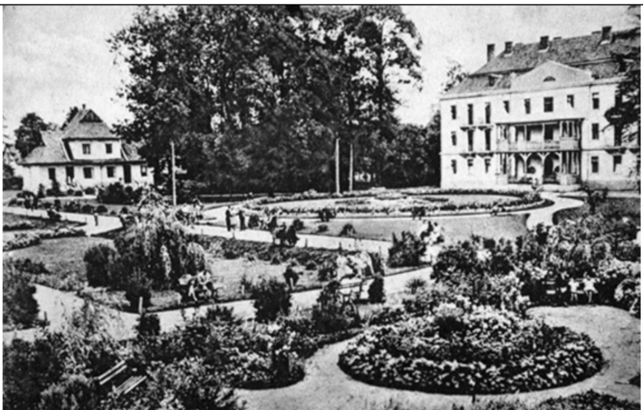
Курорт Великий Любінъ – перша чверть XX ст.