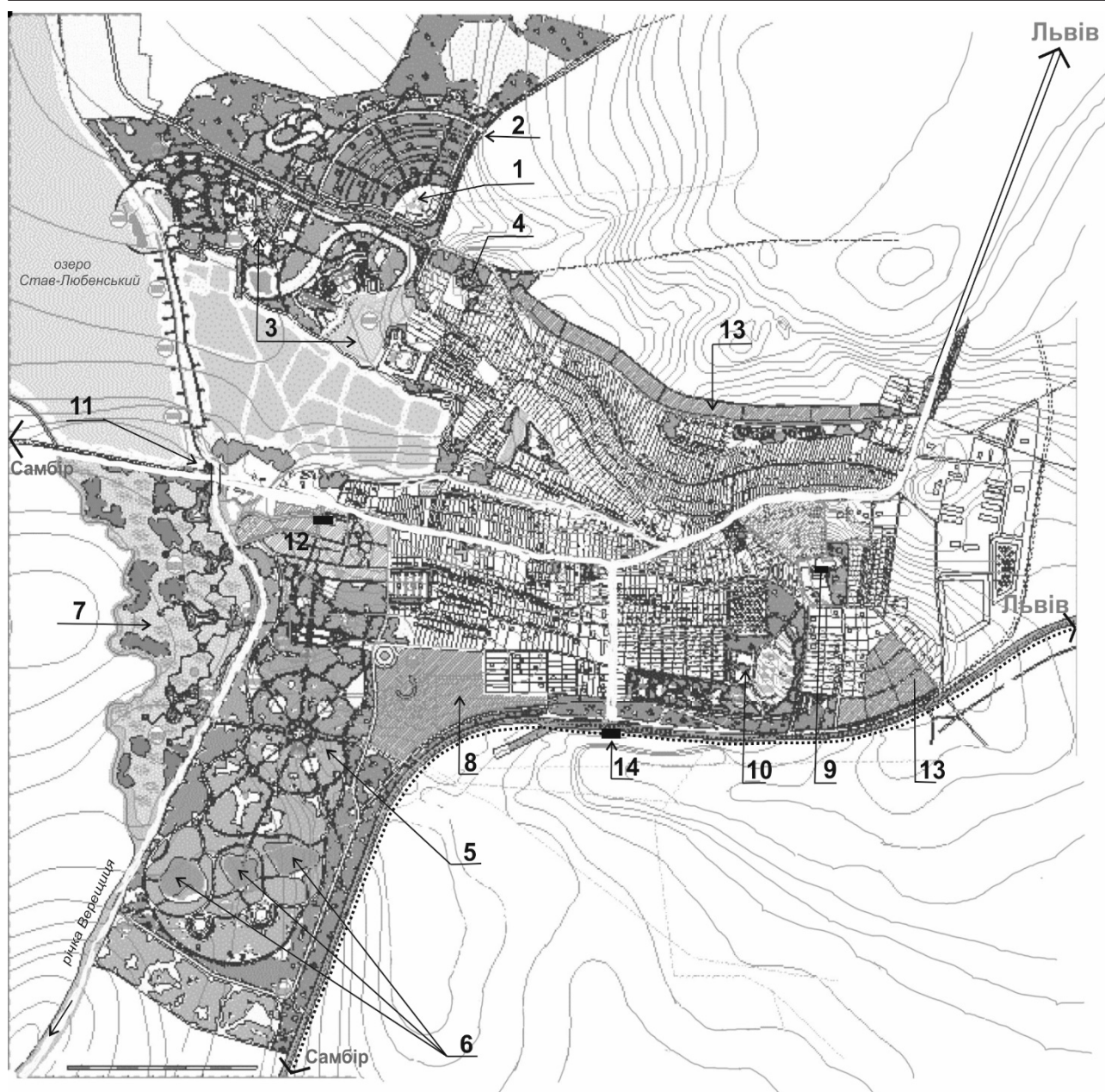
Рис. 5. Пропозиція архітектурно-ландшафтної реорганізації курорту Великий Любінь. Генплан.

1 – кемпінг; 2 – спортивно-відпочинкова база; 3 – меморіальний парк «Пагорб Слави»; 4 – мотель; 5 – історичний курортний дендропарк; 6 – прогулянковий парк березовий гай з зоною відпочинку «Лісові озера»; 7 – ландшафтний парк болотяної флори і фауни; 8 – реабілітаційний центр; 9 – територія школи-інтернату (палац Бруницьких - пам'ятка архітектури і пам'ятка садово-паркового мистецтва «Парк XVII ст.»); 10 – спортивний парк; 11 – оглядовий пішохідний міст з в'їзним знаком; 12 – санаторій Любінь Великий; 13 – агрооселі; 14 – залізнична станція