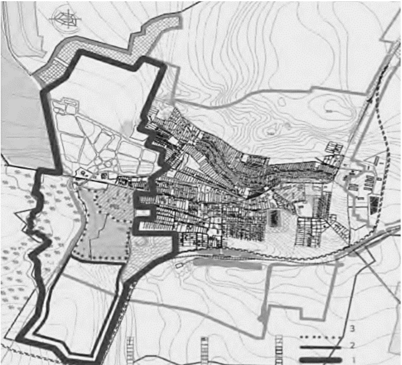
Рис. 4. Концепція розвитку рекреації в стм. Великий Любінь