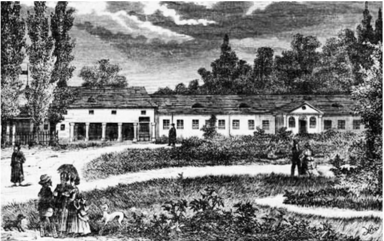
Курорт Великий Любінъ – кінець XVIII ст.