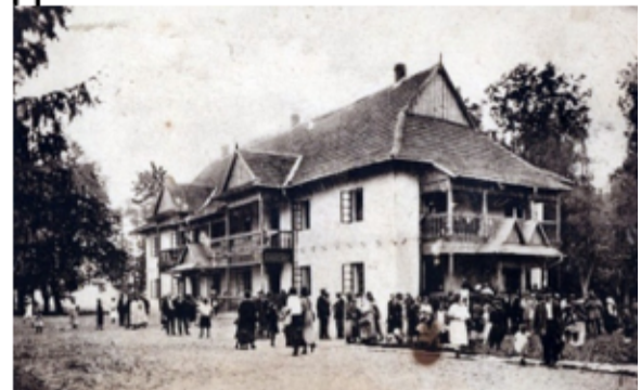
Рис. 3. Забудова курорту Великий Любінь в першій чверті ХХст.

А. – загальний вигляд санаторію; Б. - танцювальна зала; В. – ресторан; Г. – каплиця в курортному парку; Д. – вілла-пансіонат