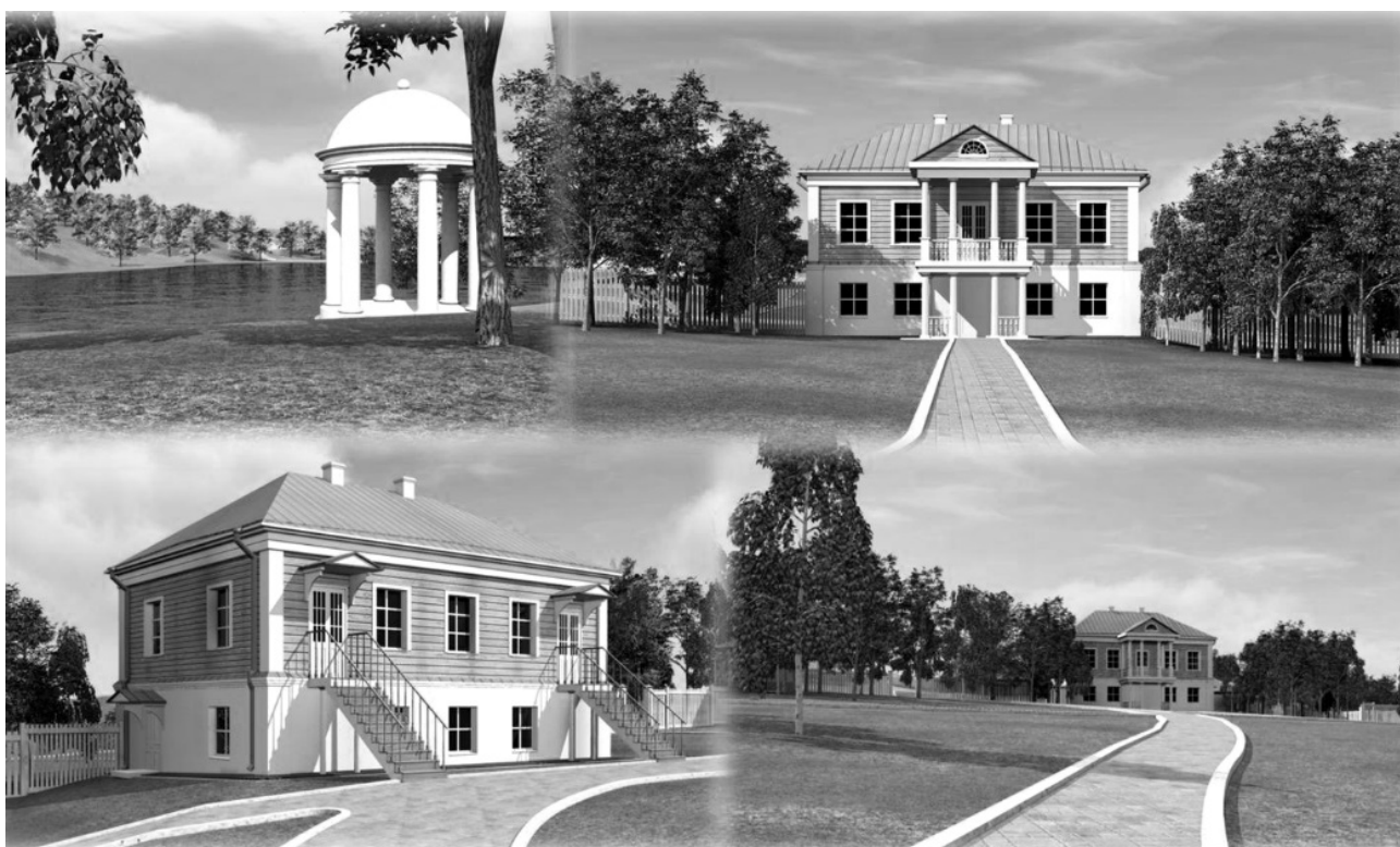
Рис. 2. Реставраційне відтворення будівель садиби Мечнікових.

Висновки: аналіз практичного досвіду з ревалоризації історичних меморіальних комплексів показав, що історико-культурна та природна спадщина в їх сукупності – це важливий економічний ресурс регіону, який може сприяти не тільки розвитку духовної складової життя, а й одним із перспективних напрямків соціальної та економічної політики в регіоні.