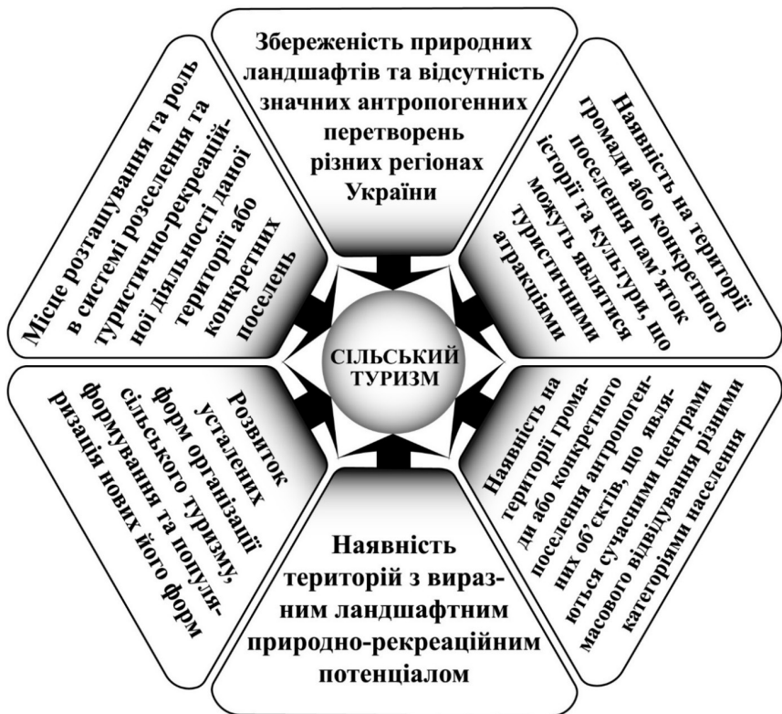
Рис. 1. Фактори, що впливають на розвиток туристично-рекреаційної діяльності в сільських територіях та поселеннях.

Франківщини); Закарпаття (частина районів Закарпатської області); Карпати (частина районів Львівської та Івано-Франківської областей); Буковина (райони Чернівецької області); Поділля (окремі райони Тернопільської, Хмельницької та Вінницької областей); Полісся (переважно південне – окремі райони Волинської, Рівненської, Житомирської, Київської, Чернігівської та Сумської областей); Слобожанщина (частина районів Харківської, Сумської, Луганської та Донецької областей); Придніпров'я (райони Полтавської, Дніпропетровської, Черкаської та Запорізької областей); Причорномор'я (окремі райони Одеської, Миколаївської, Херсонської та Запорізької областей).