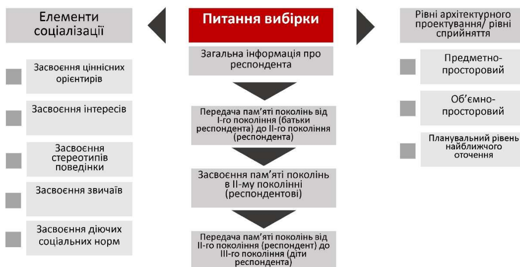
Рис. 2. Структура анкети соціологічного опитування в процесі дослідження прояву пам'яті поколінь при формуванні житлового середовища

У відповідності до визначених характеристик даного явища встановлено, що вплив пам'яті поколінь на формування житлового середовища людини - це свідомо та генетична передача, засвоєння та прояв ціннісних та соціально-поведінкових характеристик людини від одного покоління до іншого та вся множина його проявів при формуванні житлового середовища.